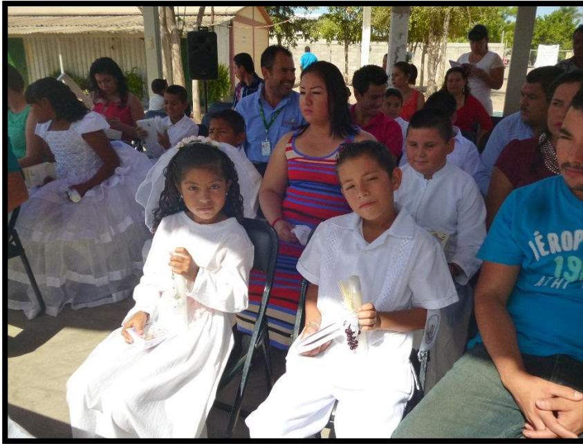
Primeras comuniones de los hijos de los colaboradores.