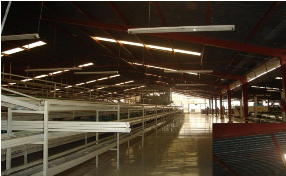
ALMACEN GENERAL DE CARTÓN