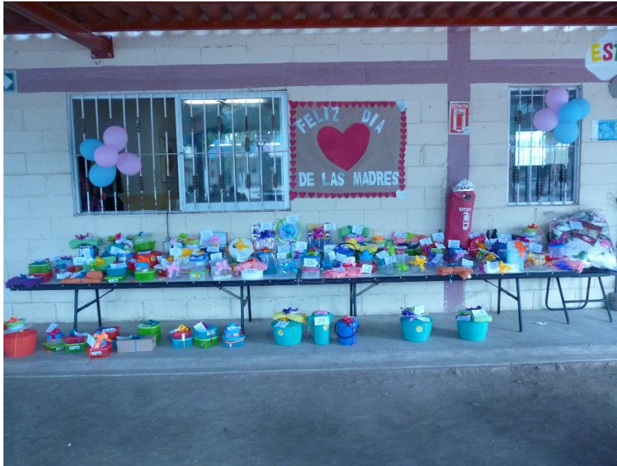
Agrícola Chaparral festeja a las mamás trabajadoras el "Día de las Madres"

También para Chaparral es muy importante realizar actividades que fomenten una cultura de convivencia entre los trabajadores e hijos, y personal administrativo.