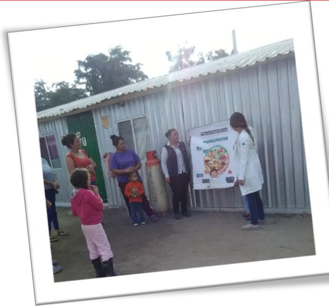
Capacitación sobre el plato del buen comer a colaboradores de Agrícola Chaparral.