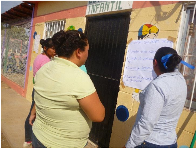
Platica a los padres de familia sobre higiene de los hijos.