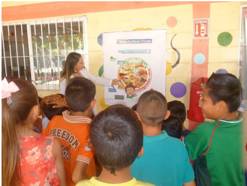
Capacitación sobre el plato del buen comer a los hijos de trabajadores de Agrícola Chaparral.