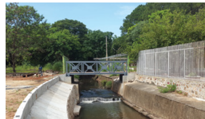
PARAGUAY TRADING (2016)

Ampliación del restaurant en planta baja del hotel, 160 m2 de cobertura metálica, cerramiento en vidrio templado y cielorraso con aislación termo acústica.