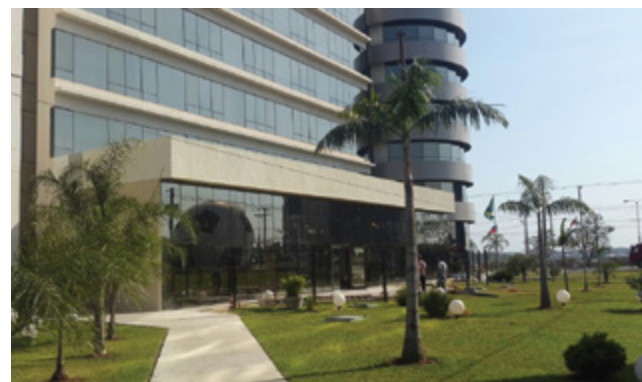
HOTEL BOURBON (2016)

Ampliación del restaurant en planta baja del hotel, 160 m2 de cobertura metálica, cerramiento en vidrio templado y cielorraso con aislación termo acústica.