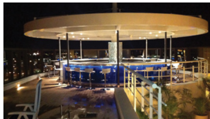
HOTEL BOURBON (2012)

Bar construido en el sector de la terraza de Hotel utilizando una estructura metálica en forma de sombrilla.