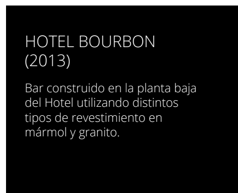
HOTEL BOURBON (2013)

Bar construido en el sector de la terraza de Hotel utilizando una estructura metálica en forma de sombrilla.