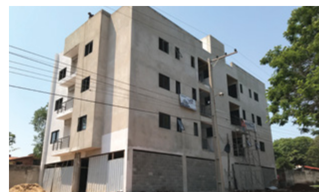
EDIFICIO LOS NARANJOS (2017)

Construcción de 1.000 m2 de edificio de departamentos de 4 niveles con estructura de hormigón armado, trabajos de albañilería en general, instalaciones sanitarias, instalaciones eléctricas, terminaciones en general.