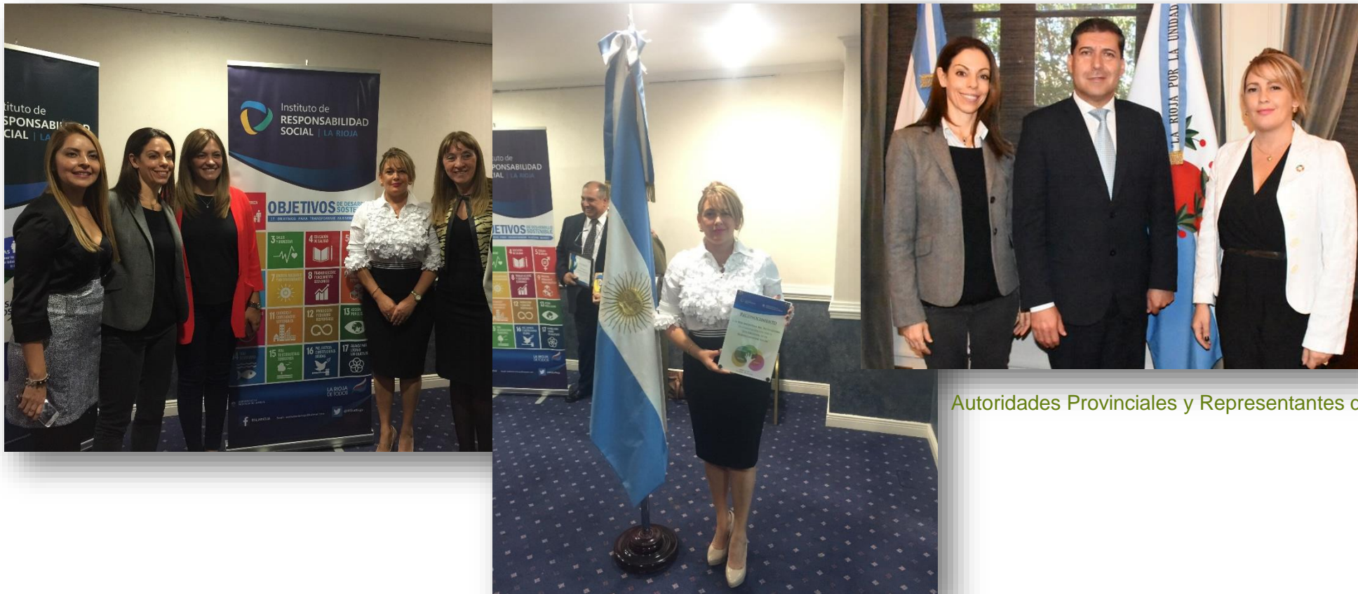
Autoridades Provinciales y Representantes de Naciones Unidas