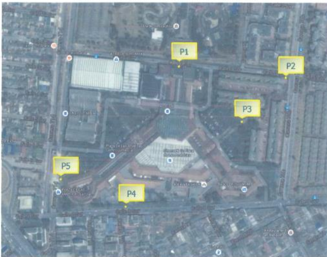
Figura 2-1. Ubicación puntos de emisión de ruido