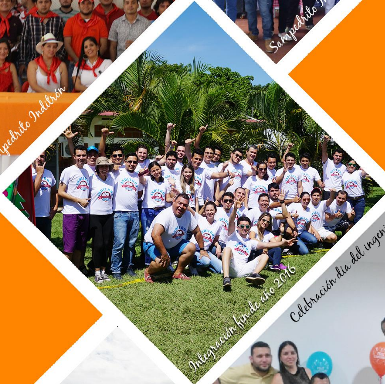
Integración fin de año 2016