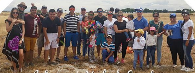
Integración Vuelo de Cometa