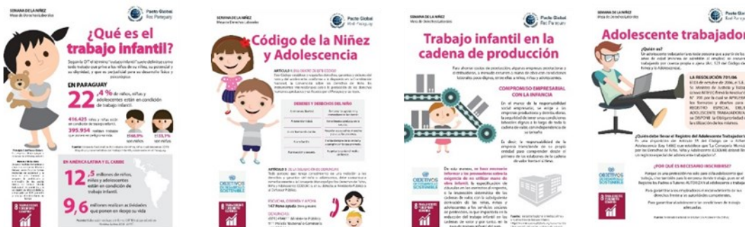
Algunos de los elementos visuales difundidos en la campaña por la niñez de 2016

Del 16 al 20 de Agosto de 2016, se realizó una campaña de comunicación por la semana de la niñez en la que PLAN participó activamente en conjunto con los miembros de la mesa de derechos laborales.