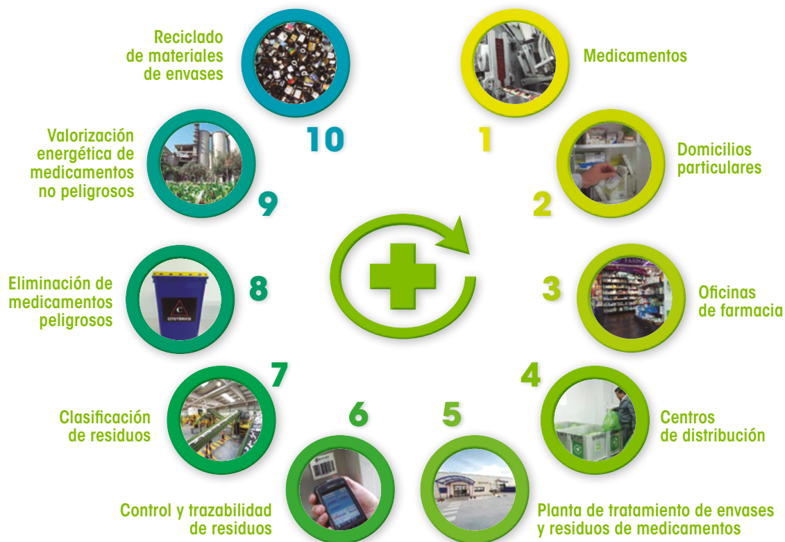
Gráfico de funcionamiento, a través de la logística inversa, de SIGRE.

1.400 toneladas de CO 2 anuales) y de eficiencia económica, además de garantizar el control de los residuos por los agentes legalmente autorizados para la distribución y dispensación de los medicamentos, evitándose así cualquier situación de riesgo para la salud pública (sustracciones, venta ilícita, falsificaciones, etc.).