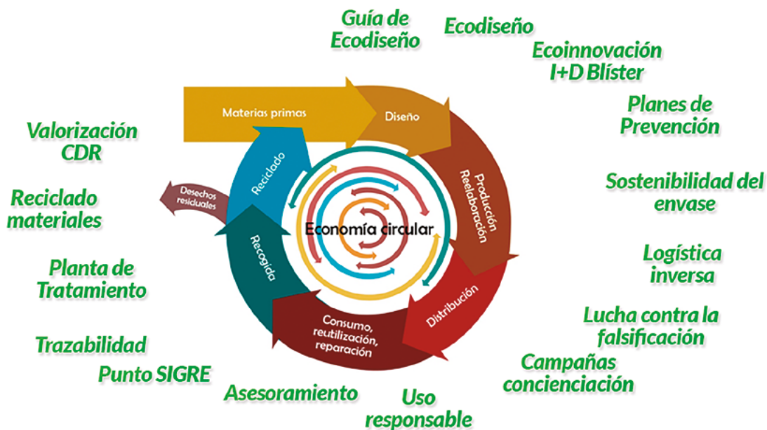
Acciones de economía circular emprendidas por SIGRE.

A continuación os contamos dos de los principales ámbitos de nuestra actuación responsable en materia medioambiental, si bien esperamos que visitéis nuestra Memoria de Sostenibilidad on line para poder conocer el compromiso con nuestro entorno que hemos intentado reflejar en todos los apartados que la conforman.