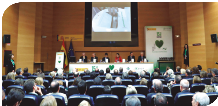
Imagen del Acto Central celebrado en noviembre de 2016 para conmemorar los 15 años de SIGRE cuidando el medio ambiente.

15º aniversario, concedidas por nuestro Consejo de Administración a las personalidades e instituciones que más han contribuido durante este periodo a la consecución de los objetivos ambientales y socio-sanitarios alcanzados.