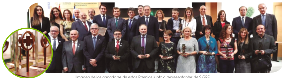
Imagen de los ganadores de estos Premios junto a representantes de SIGRE

A través de estos galardones, quisimos reconocer a los medios de comunicación españoles y a los profesionales de la información por su enorme contribución al desarrollo de una cultura medioambiental en nuestra sociedad.