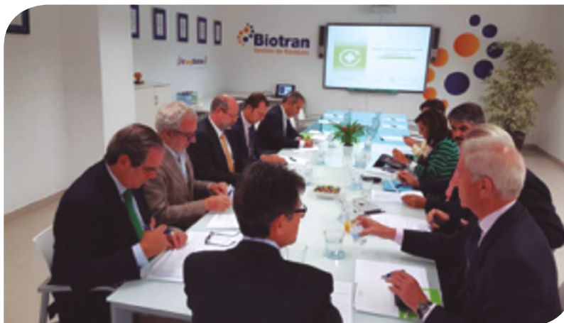
Celebración de un Consejo de Administración en la Planta de Tratamiento.