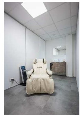
« Le plus » ACRITEC Notre salle de sieste