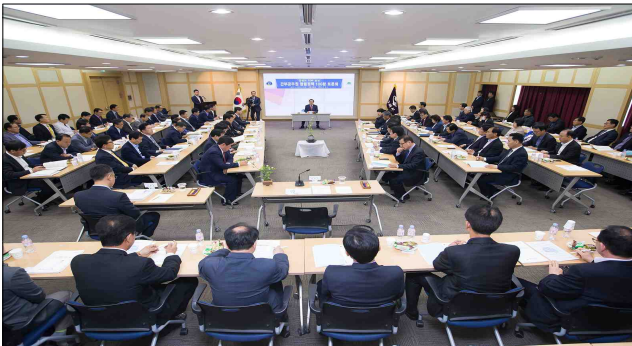
간부공무원 청렴정책 100분 토론회

○ 이밖에 청렴문화 확산을 위해 전 직원 청렴교육 이수, 청렴해피콜, 청렴방송, 청렴연극단 운영, 노조와의 청렴실천 협약식 개최 등을 통하여 직원들의 청렴의식 제고와 공감대 확산에 기여하고 있습니다 .