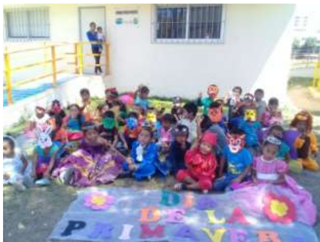
Festejo del día de la Primavera