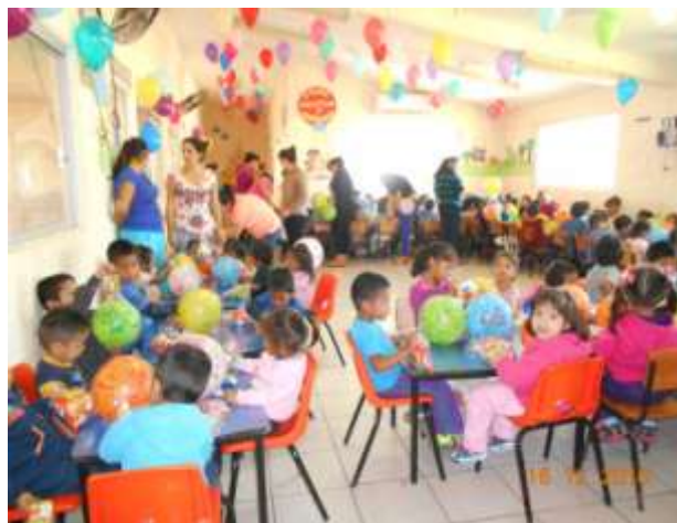
Festejo del día del niño