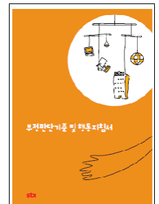
부정판단기준 및 행동지침