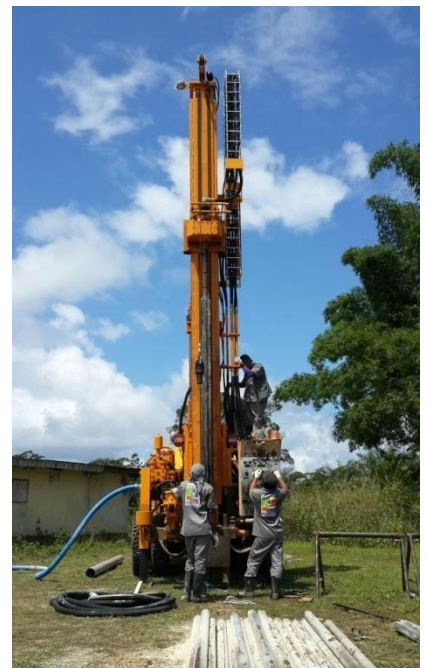
콩고 정수설비 수출사업 현장