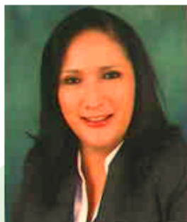
JEFE DE AGENCIA REINA VICTORIA