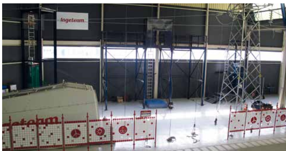
Centro de formación de prevención de riesgos laborales de Albacete. Certificado GWO

Por último destacar que este año para la campaña de concienciación de Prevención de Riesgos Laborales, se ha llevado a cabo la campaña de "Vida Saludable".