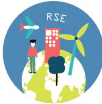
MOBILISATION AUTOUR DE LA DÉMARCHE RSE