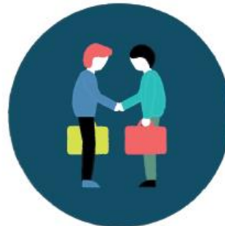
LOYAUTÉ DES PRATIQUES COMMERCIALES