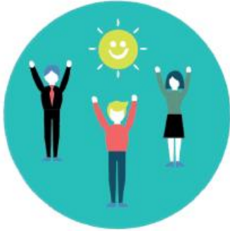
ÉPANOUISSEMENT DES COLLABORATEURS