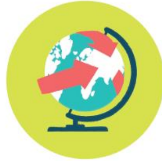
RÉDUCTION DES IMPACTS ENVIRONNEMENTAUX