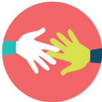
DÉMARCHES SOLIDAIRES OU DE PARTAGE