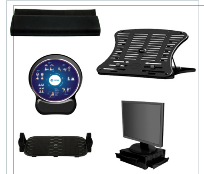
Apoio de punho para teclado, suporte para notebook, mouse pad, apoio para os pés, suporte de mesa para o monitor

Praticamos a impressão consciente por meio de software de gestão, sendo possível extrair o volume e identificar o material impresso até o nível do usuário. Utilizamos também o “scan to mail” para envio direto do documento em formato digital ao usuário.