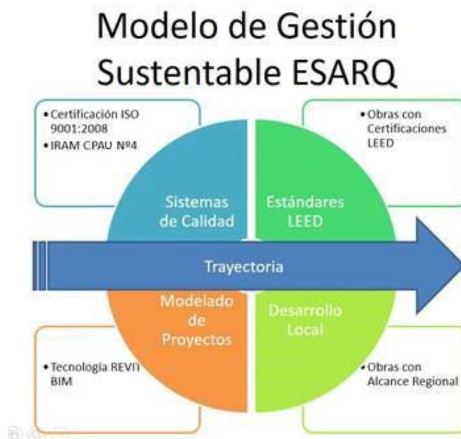
Imagen 1: Modelo de Gestión Sostenible de ESARQ.

A continuación, se presenta el Modelo de Gestión Sostenible que ESARQ viene implementando y cuyos cuatro ejes de trabajo, marcan la trayectoria que la empresa viene siguiendo en términos de su contribución a un desarrollo sostenible.