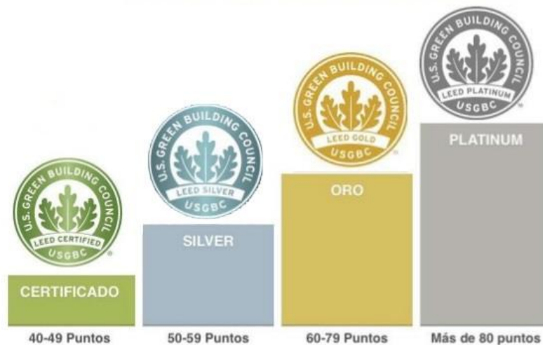
Imagen 2: Niveles de certificación de la Norma LEED.

ESARQ considera que no se puede dar una solución sin antes conocer y comprender por medio de un diagnóstico. Es por eso que el proceso de diseño comienza con un relevamiento y estudio exhaustivo del sitio, en el que se analizan el nivel de desarrollo previo del mismo, priorizando la reutilización y puesta en valor de sitios ya construidos, y así evitar la intervención en espacios naturales sin desarrollar. Adicionalmente, se analiza la climatología del lugar y sus recursos hídricos y energéticos con el objeto de ejercer un uso responsable y eficiente de los mismos. En este sentido, se identifican cuestiones como el aprovechamiento del agua de lluvia y el acondicionamiento del edificio en forma pasiva y teniendo en cuenta la orientación más favorable del edificio.