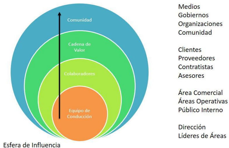
Imagen 3: Partes interesadas identificadas por ESARQ.

Entre los distintos aspectos que hacen a las buenas prácticas del sector de la construcción, el plazo de obra resulta clave y ESARQ lleva un detallado monitoreo y control del mismo. Si bien las empresas constructoras son las responsables en el cumplimiento de los mencionados plazos, ESARQ cumple un rol de Director de Obra donde controla la correcta ejecución de las tareas en tiempo y forma, y atento a los posibles desfasajes que pudieran ocurrir.