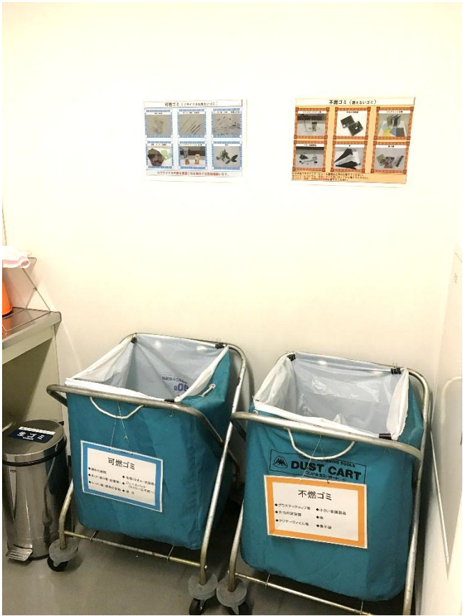
写真入りゴミ分別表