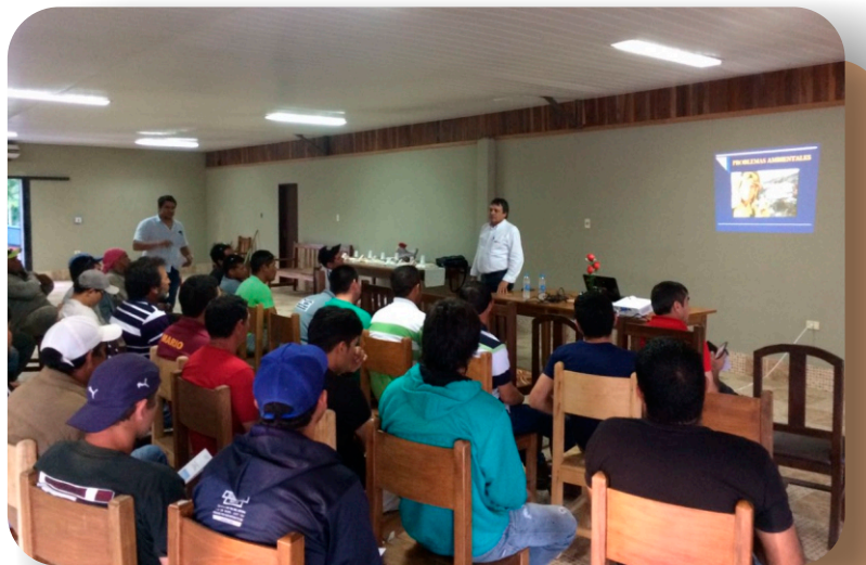
Repotenciación LT 2x220 Ayolas San Patricio

El personal de obras recibe capacitación sobre cuidados del medioambiente, seguridad e higiene del trabajo, primeros auxilios, legislación ambiental, laboral y de seguridad ocupacional. Además, reciben adiestramiento para la implementación de planes de contingencia sobre accidentes, incendios y otros.