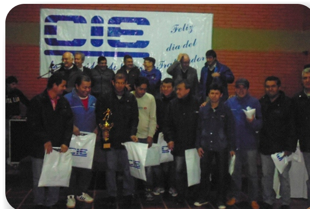
Equipo CDP- Campeón

Organización de Torneo de fútbol con la participación de equipos de distintas áreas. En la clausura del torneo se ofreció un brindis con motivo del día del trabajador.