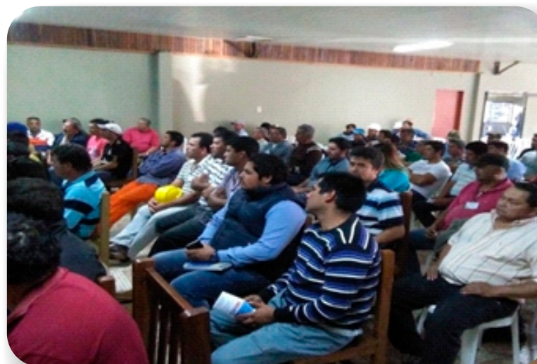
LT 500 kV Yacyreta-Ayolas Villa Hayes