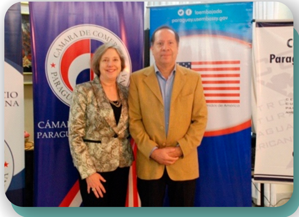
Ing. Marco Martínez junto a la embajadora de los Estados Unidos en Paraguay, Leslie Ann Bassett.

Como cada año, se ha donado una beca completa para el estudio del idioma inglés para jóvenes de escasos recursos, en el marco del Programa de becas 2016 promovido por la Embajada de EEUU, La Cámara de Comercio Pyo-Americana, la Fundación AMCHAM y el Centro Cultural Pyo-Americano.