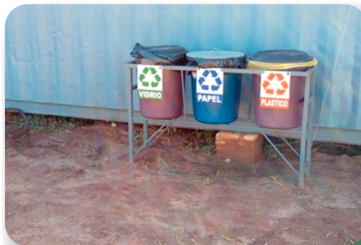
SE Barrio San Pedro - Guajaybi

CIE solo participa en proyectos debidamente licenciados por la autoridad ambiental competente. Dentro de su staff de asesores cuenta con especialistas ambientales que tienen a su cargo asegurar el cumplimiento de los Planes de Gestión Ambiental de cada obra en ejecución.