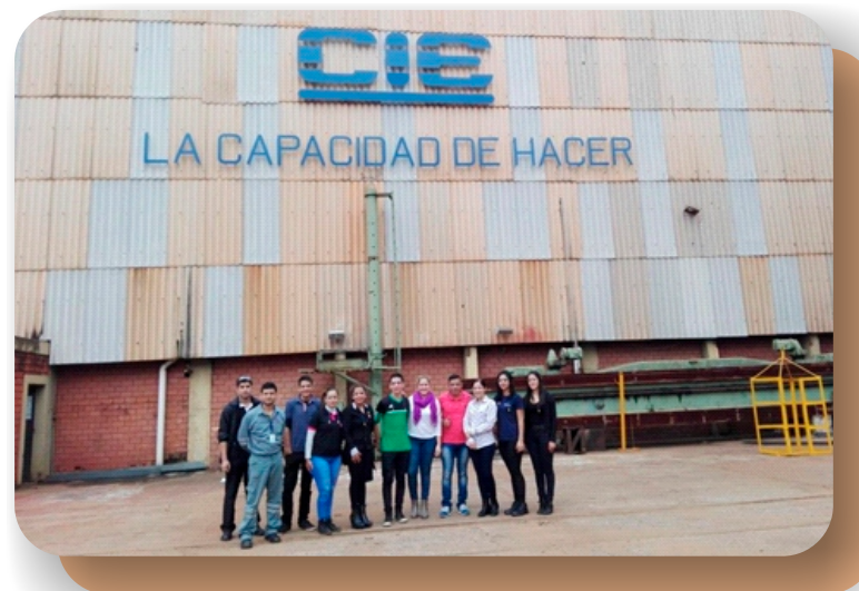
Alumnos de la Universidad Técnica de Comercialización y Desarrollo (UTCD)