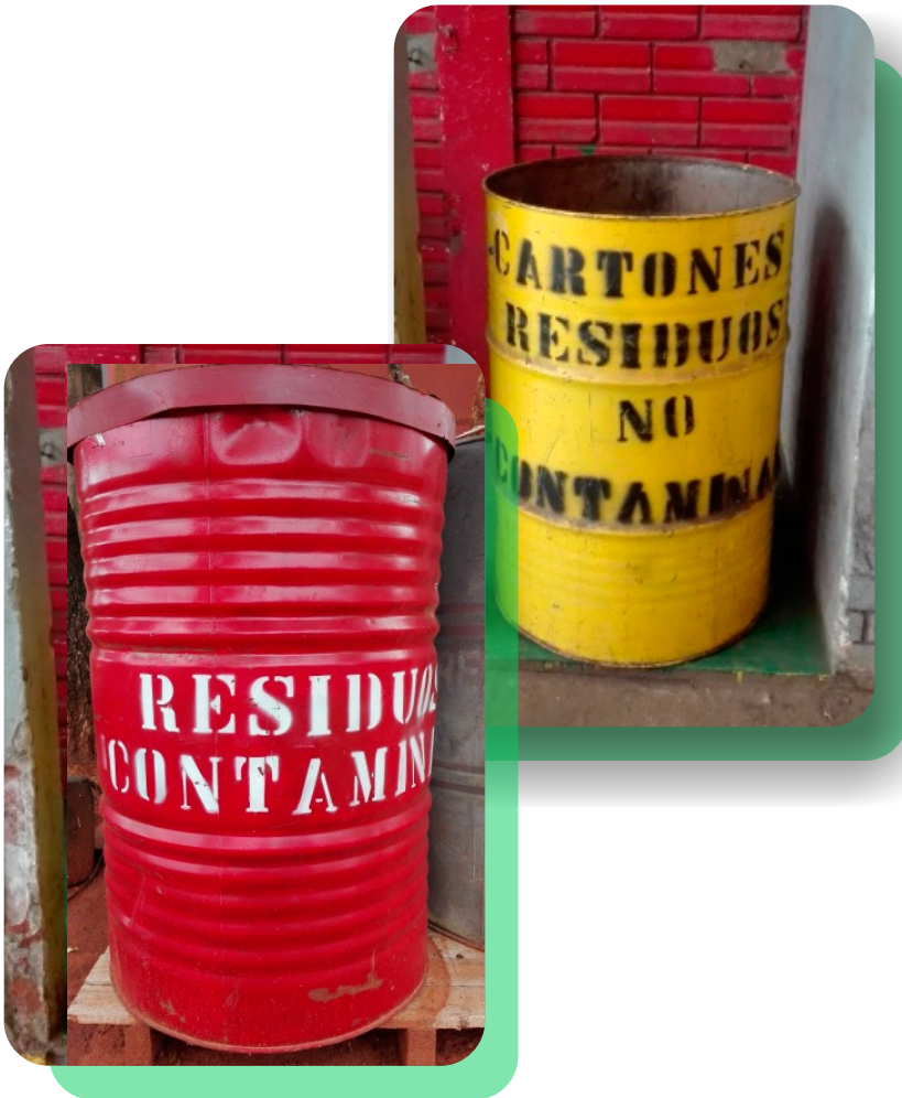
Contenedores de Residuos Contaminados y No Contaminados ubicados en toda la Empresa.

Se continúan con las prácticas de mediciones de control de humo, ruido perimetral, agua, disposición de residuos y sustancias peligrosas, mantenimientos de las piletas de contención para los tanques y expendio de combustible.