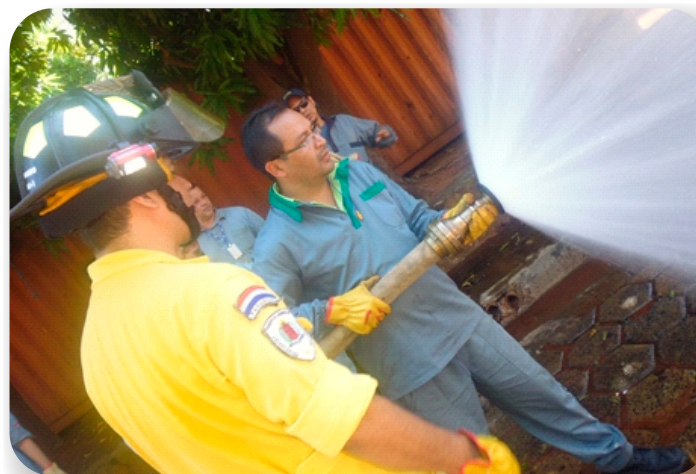
Capacitación Brigada de Emergencia

Se destacan las capacitaciones realizadas para el personal con cargos gerenciales, mandos medios y el personal operativo, en instituciones nacionales e internacionales, además de las dictadas por instructores internos en CIE, tales como inglés básico y avanzado, herramientas informáticas, soldadura, habilidades gerenciales, interpretación de planos, Trigonometría y Geometría, etc., además de Tecnicatura Naval, Maestría en Dirección de Empresas, Maestría en Construcciones Navales y Diseño de recipientes contenedores de presión según Código ASME en IAS Argentina.