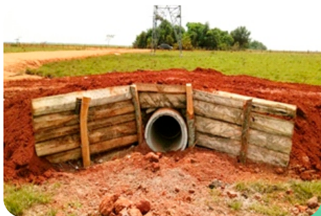
Reparación de Vías de uso Público – LT 500 kV Yacyretá-Ayolas-Villa Hayes