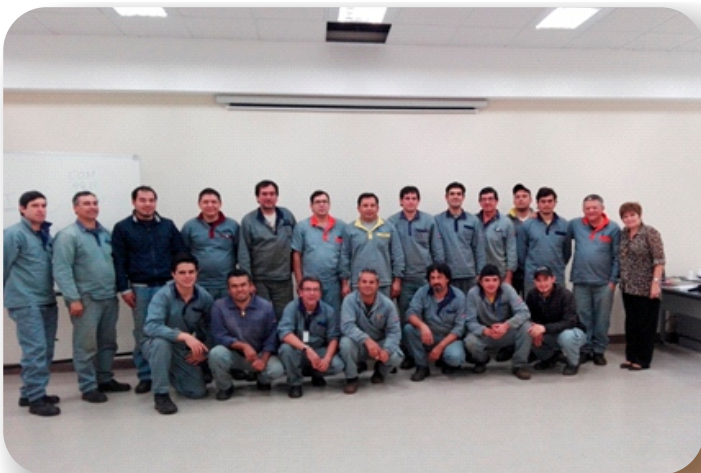
Desarrollo de Habilidades para Supervisores

En materia de capacitación, en el año 2016 se totalizaron 6.288 hs de curso , con un índice de 39 hs de capacitación por año por funcionario y con un nivel del cumplimiento del Plan Anual de Capacitación del 72% .