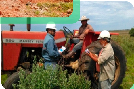
Campañas de Información Pública: Informando a la Comunidad acerca del proyecto.