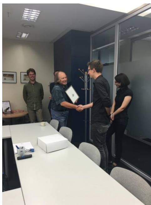
Sveikinimai įvairiomis progomis