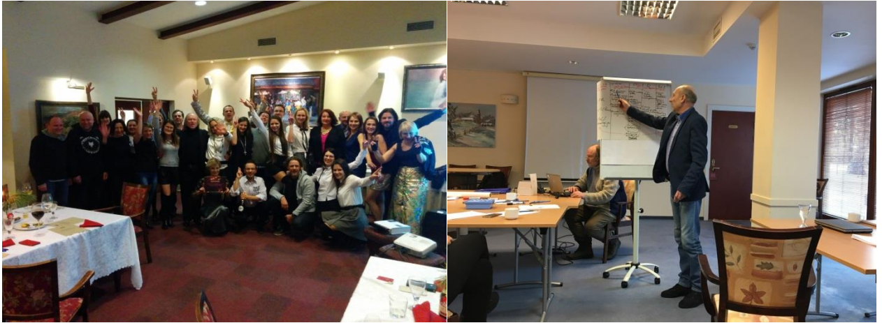
Kalėdinis vakarėlis Druskininkuose