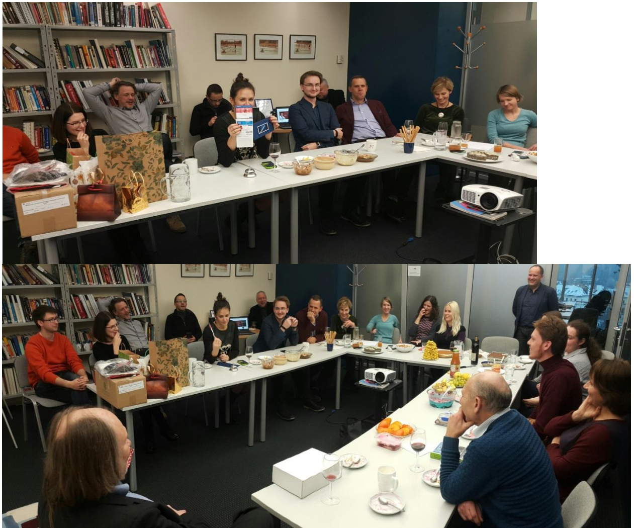
Prieššventinė vakarienė - aukcionas

■ Rugsėjo 3-įją dieną vyko jau tradicinė, 16-ioliktoji „Vilniaus Regata“ . Regatos dalyviai startavo Valakampių antrajame plaže, finišavo – Žvėryne, po pėsčiųjų tiltu. Masiniame plaukime dalyvavo 209 dalyviai (97 ekipažai), iš jų 14 UAB „Ekonominės konsultacijos ir tyrimai“ darbuotojų (7 ekipažai), kartu su antrosiomis pusėmis, vaikais ir kitais šeimų nariais.