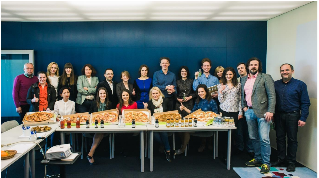
Tarptautinė diena be dietų

kad tik liesas žmogus gali būti laimingas. EKT šią dieną nusprendė visiems drauge papietauti, skanaujant skirtingas picas.