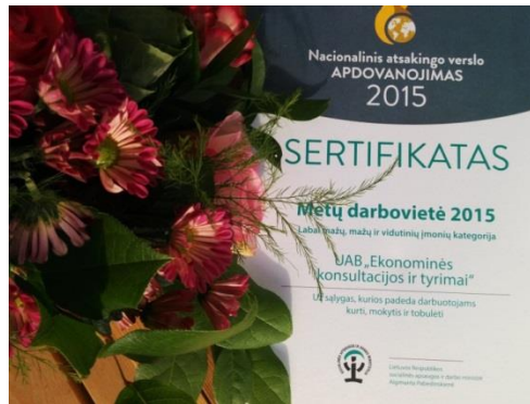
NAVA apdovanojimų sertifikatas

Socialinė atsakomybė. 2016 m. EKT gavo specialų sertifikatą už sąlygas, kurios padeda darbuotojams kurti, mokytis ir tobulėti.