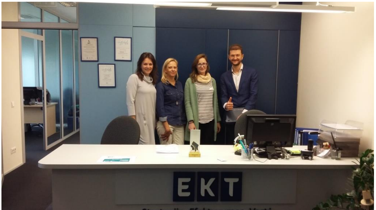
Susitikimas su konkurso „Verslas atsakingai“ organizatoriais

■ EKT kiekvienais metais dalyvauja VŠĮ „Rūpi“ organizuojamame konkurse „Verslas atsakingai“ konkurse . Konkurso „Verslas atsakingai“ tikslas – skatinti verslo atsakomybę, išrinkti ir apdovanoti atsakingiausią Lietuvos įmonę.