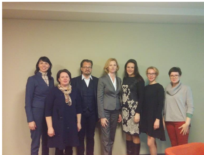
LAVA valdybos rinkimai