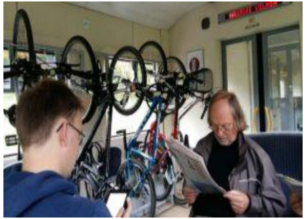
Dviračių žygis Ignalinoje

■ EKT nuolat stengiasi stiprinti savo atsakingo verslo politiką. Įmonės vadovai atsižvelgia į darbuotojų nuomonę ir pageidavimus, prie kokios socialinės atsakomybės veiklos jie norėtų prisidėti, kokios socialinės problemos jiems rūpi. Nuo pernai metų EKT turi tradiciją – prieššventinius kalėdinius EKT pietus , kuomet atsinešame ir vieni su kitais dalinamės pačių pagamintu maistu.