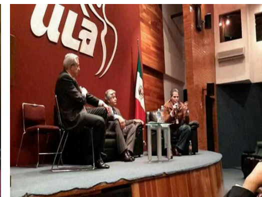
ACTIVIDADES CONJUNTAS DEL GOBIERNO CORPORATIVO