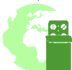
Impacts sociétaux des produits

Ces enjeux, structurés en 4 piliers, sont cohérents avec les guidelines de la GRI G4 (Global Reporting initiative V4), le Pacte Mondial et les pratiques du secteur :