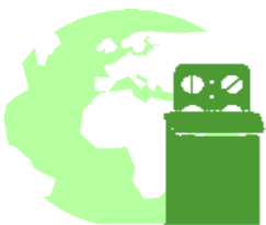
Impacts sociétaux des produits