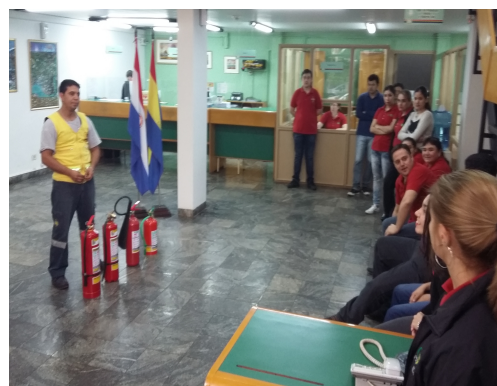
“ Capacitación uso de extintores”