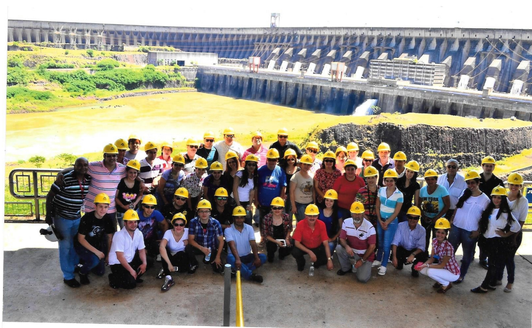
Visita de Funcionarios y Dirigentes de COS a Itaipu Binacional