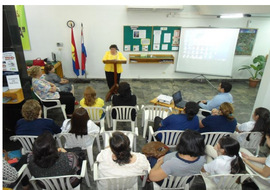
“Dia Internacional de la mujer”

Principio 2: Las empresas deben asegurarse de no ser cómplices de la vulneración de los derechos humanos.