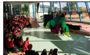
Ямболският куклен театър на гости на децата

В стремежа си да допринесе максимално за този проект Овергаз често обвързва своите социални проекти и спомоществователства с училището. Затова там често може да видите гостуващи театрални спектакли, творци, музиканти, писатели, които да посвятат зрънца в културното израстване на децата.