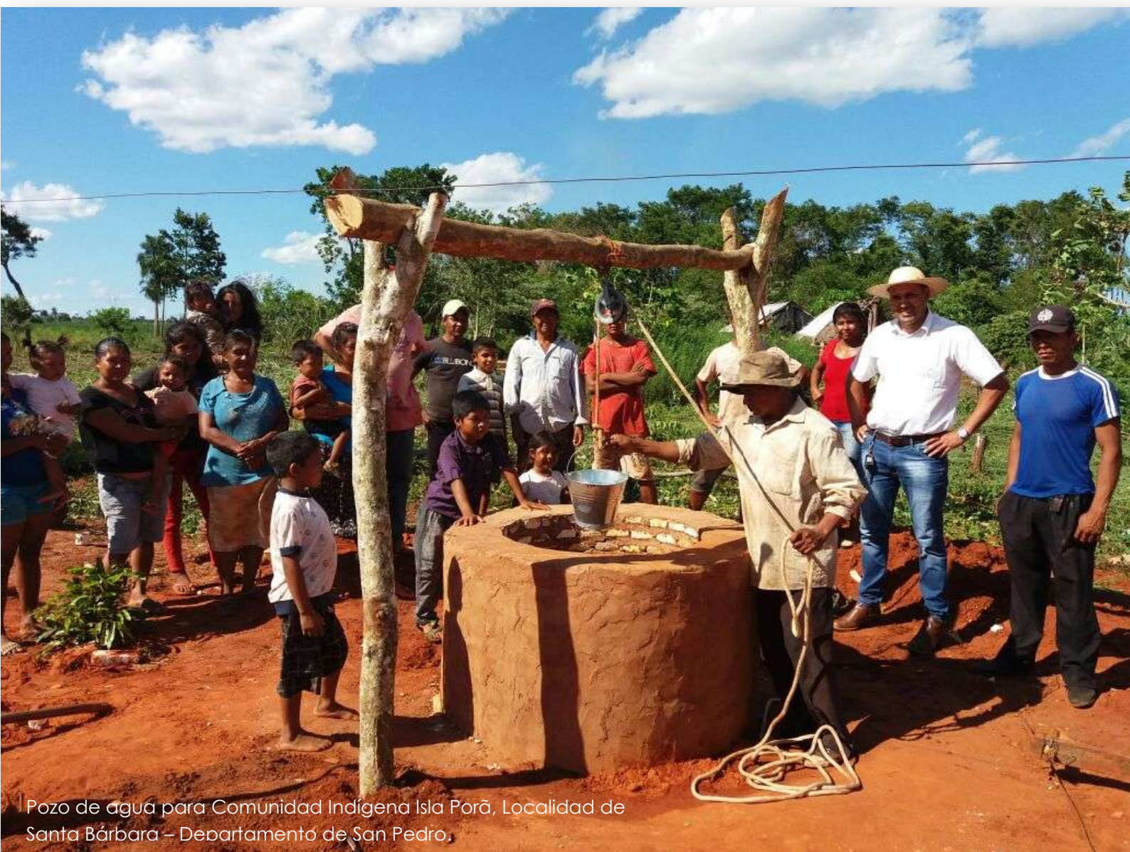
Pozo de agua para Comunidad Indígena Isla Porã, Localidad de Santa Bárbara – Departamento de San Pedro.