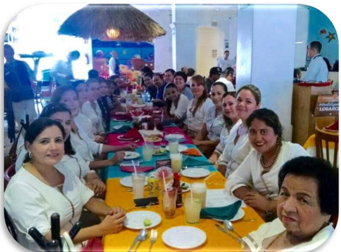
Día del profesional administrativo