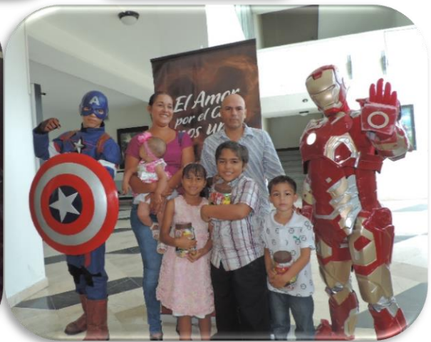
Matiné cine en familia