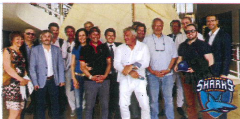
Le Sharks Business Club