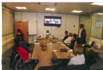
Accueil de la Communauté myRSE