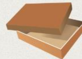
Tapas y Charolas (Teléscopica)