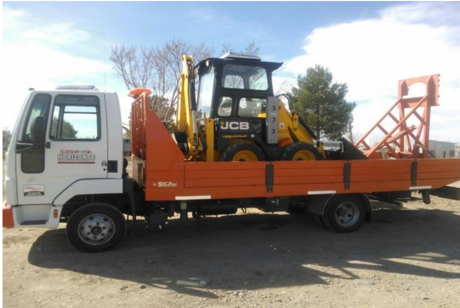
Equipo Móvil de Testeo con Carga / Descarga de acción Hidráulico.