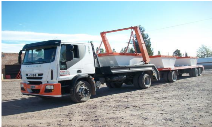
Camión Porta contenedor Extensible con acoplado