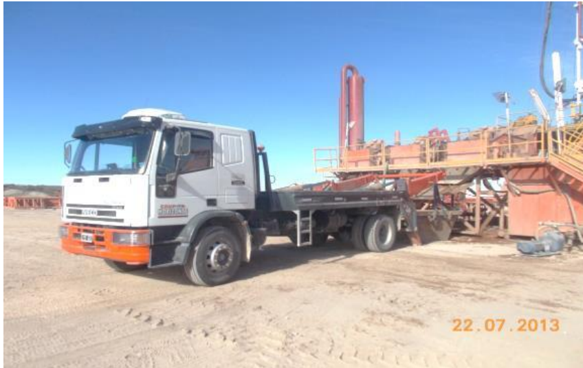
Camión Porta contenedor Extensible