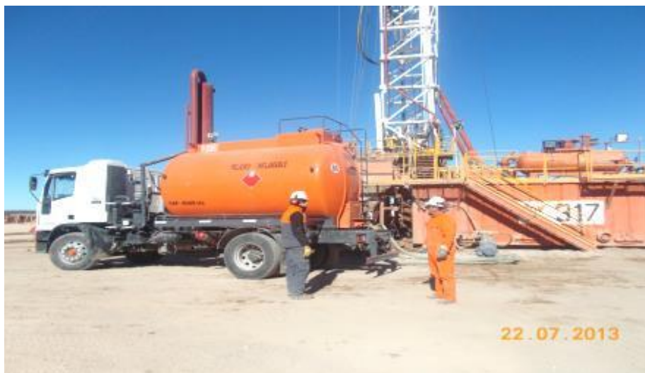
Camión recuperador de 8 m 3 - Bomba 5003 s/aceite