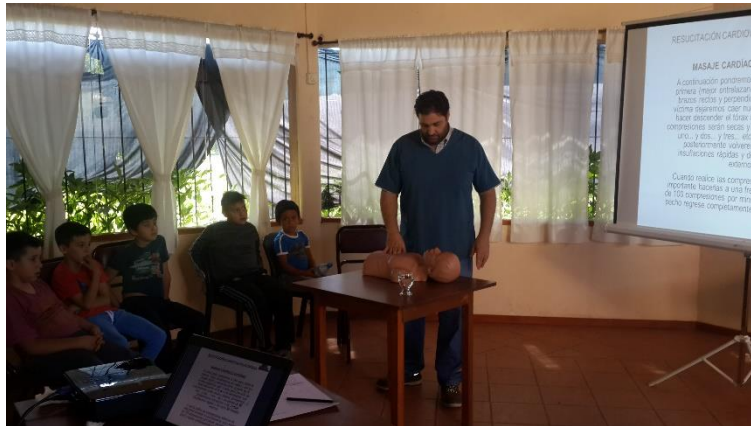
Inicio Capacitación RCP