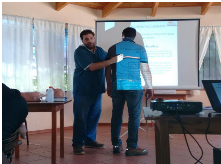
Explicación Maniobra de Heimlich