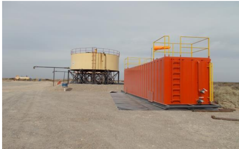
Pileta de 60 m3 sobre patines apta para la recepción de líquidos varios