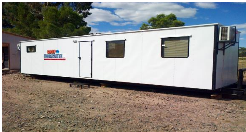
Tráiler Habitacional para Equipo Perforador