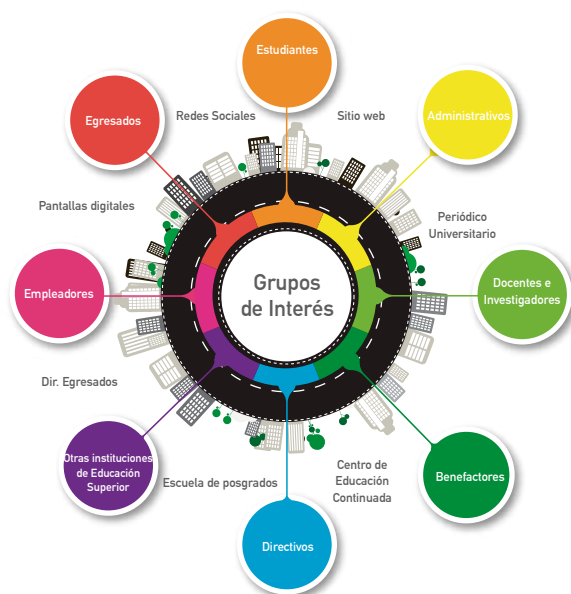
Gráfico 1.0 Identificación de grupos de interés