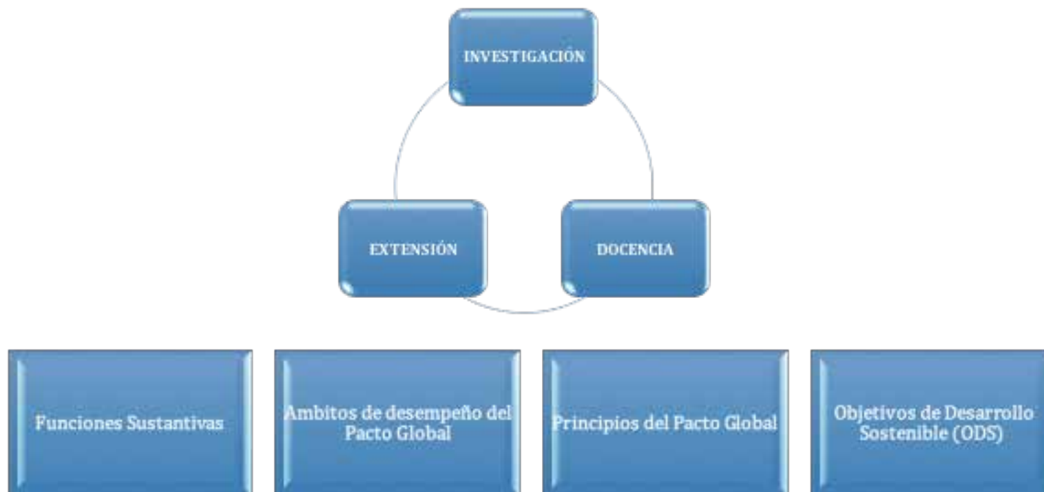
Gráfico 2.0 Modelo de interacción institucional- Agenda 2030 para el Desarrollo Sostenible.