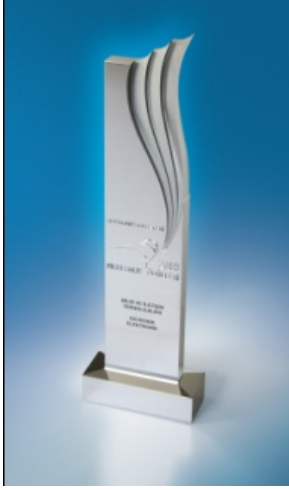
Hızlı Balık Ödülü