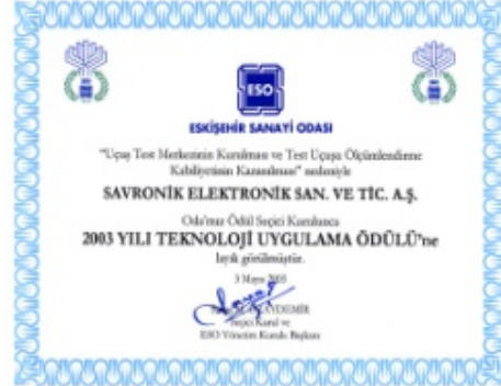
ESO 2003 Yılı Teknoloji Uygulama Ödülü