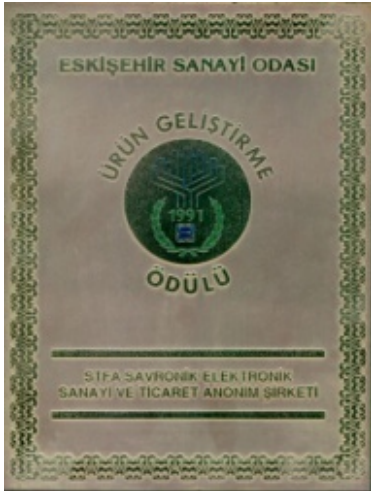
ESO Ürün Geliştirme Ödülü