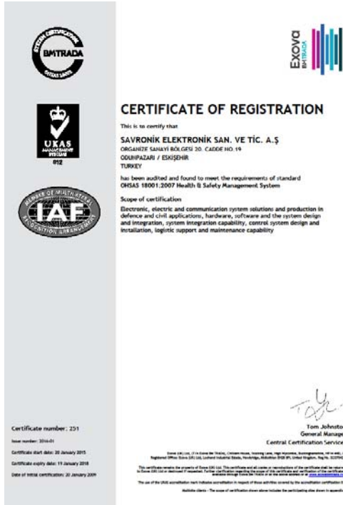
TS EN ISO 18001:2007 İş Sağlığı ve Güvenliği Yönetim Sistemi