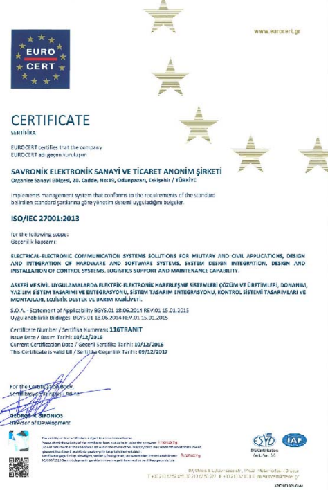
ISO/IEC 27001:2013 Bilgi Güvenliği Yönetim Sistemi