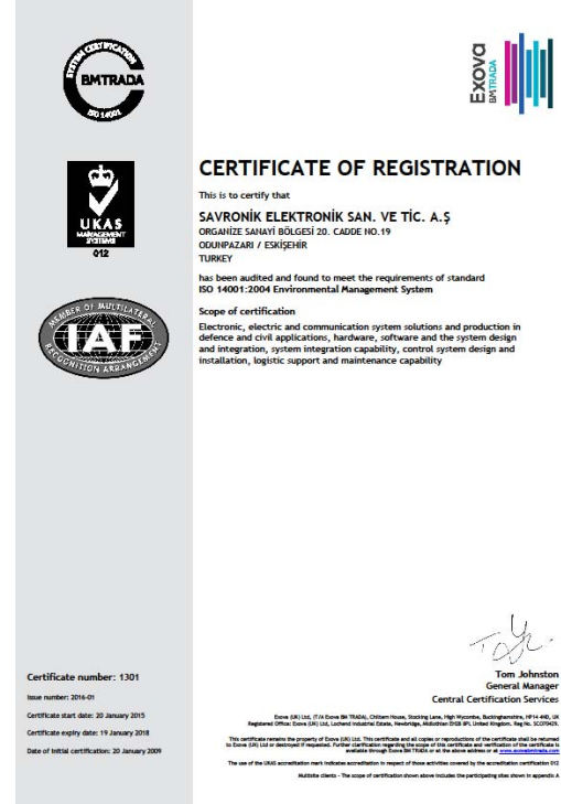
TS EN ISO 14001:2004 Çevre Yönetim Sistemi