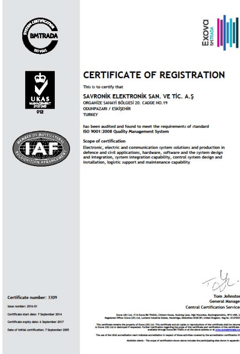
TS EN ISO-9001:2008 Kalite Yönetim Sistemi