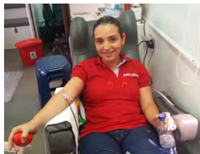
Donación de Sangre

Comités: La Compañía cuenta con comités que permiten la constante comunicación con nuestros colaboradores, el comité de convivencia laboral quienes se reúnen trimestralmente para tratar casos relacionados no solo a temas de acoso laboral sino a plantear estrategias de convivencia sana y de integración. Comité Paritario de Seguridad y Salud en el trabajo (Copasst) comité que actúa como ente regulador en cuanto al Sistema de Gestión de Seguridad y Salud en el Trabajo. La compañía desarrolla actividades encaminadas a mitigar y controlar los peligros a los que están expuestos los trabajadores, apoyados en programas como el de “cero accidentes”, y preparación de la brigada de emergencias.