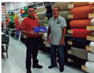
Mes del Tapicero

Cada año nos acercamos a ellos, no solo con nuestros productos sino con el valor agregado que ofrecemos, es así como durante el año tuvimos actividades de acompañamiento como el mes del tapicero y la celebración del día de los niños: