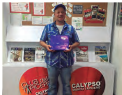
Mes del Tapicero