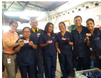
Prevención de Accidentes