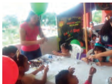
Día del niño