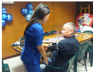
Campaña de Prevención cardiovascular