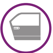
6 nuevos centros de reparación

Para facilitar los procesos de mejora continua, nuestros proveedores cuentan con herramientas que les permiten conocer mensualmente los indicadores de su desempeño como: días de entrega, costos y desempeño en el cotizador.