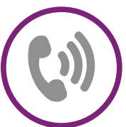
Número 01-800 para recibir asesoría

En el aspecto ambiental, el Programa establece lineamientos básicos en cuanto al manejo de residuos, emisión de contaminantes y condiciones de trabajo seguras.