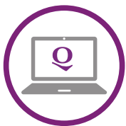
Portal Q Proveedores