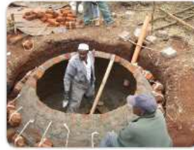
Bau einer Biogasanlage in Kenia