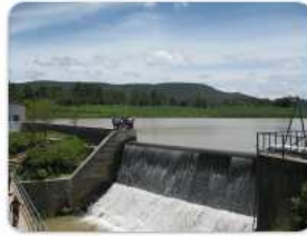
Kleinwasserkraftwerk in Honduras.