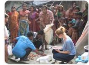
Überprüfung der CO 2 -Einsparungen im Sunderbans-Projekt in Indien