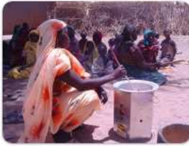
Effiziente Kocher sparen Brennholz zum Beispiel in Lesotho, Nigeria und Ruanda.