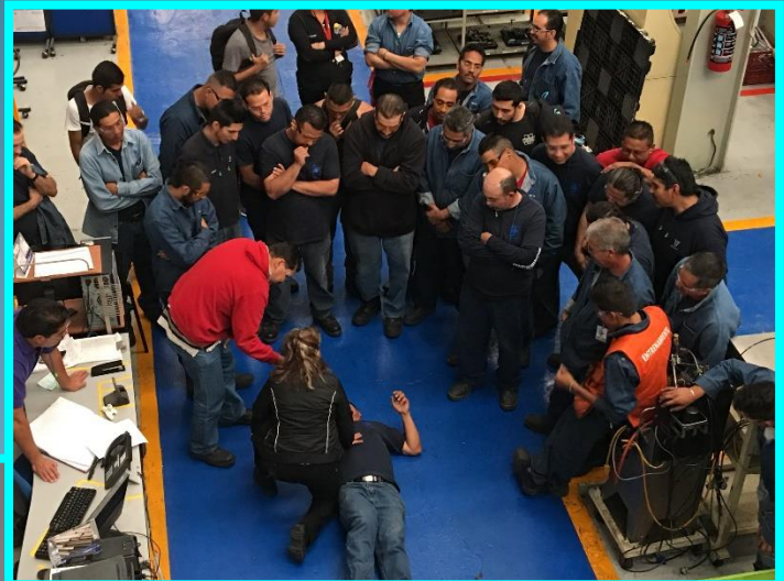
Collado Guadalajara Automotriz