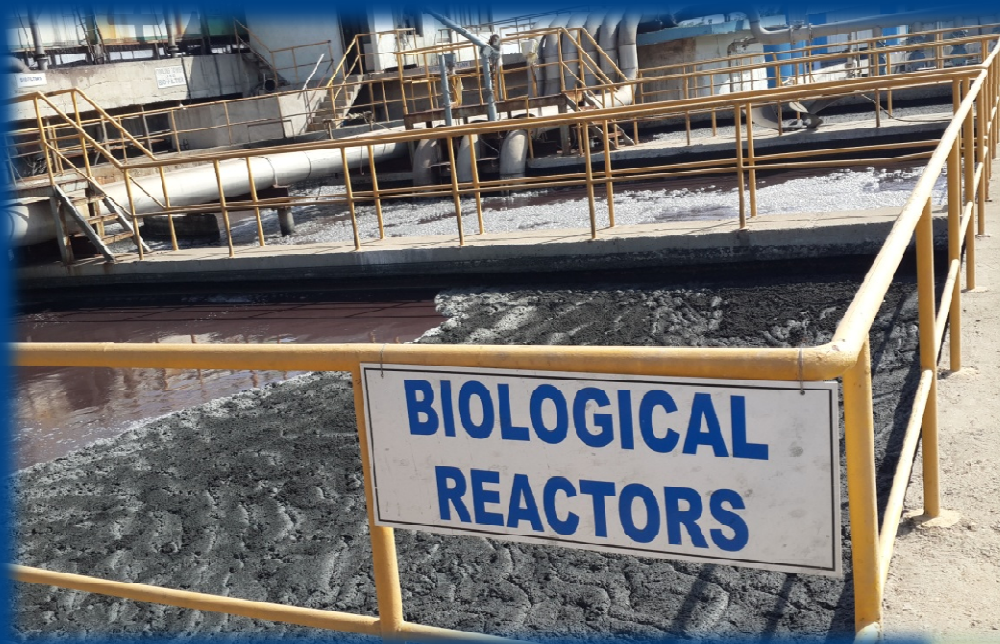
Photo modèle Station Implantée en Inde

Nous avons investi l'équivalent de 1.5 millions € pour la mise en place d'une nouvelle station biologique de traitement et recyclage des eaux usées.