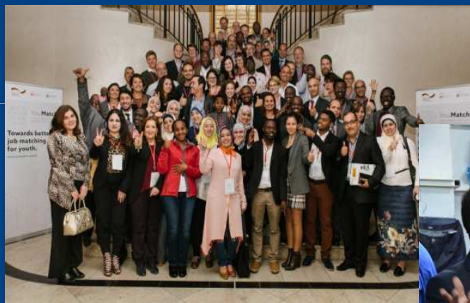
SARTEX à la Conférence de GIZ à Berlin : Youmatch For Employment

Nous participons aux événements culturels, sociaux et économiques au niveau régional et national à travers un réseau Public – Privé et Organisations de la société Civile.