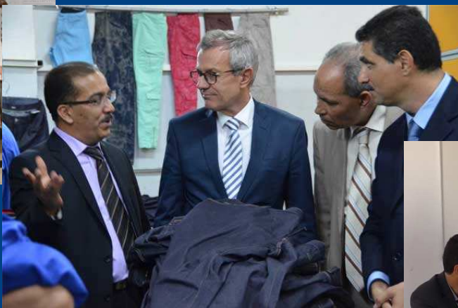
SARTEX : Lieux de rencontres des Industriels, députés et ambassadeurs