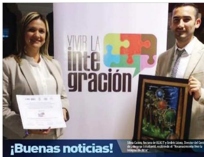
Ilustración 1: RECONOCIMIENTO "VIVIR LA INTEGRACIÓN" ACNUR: 2014-2015.