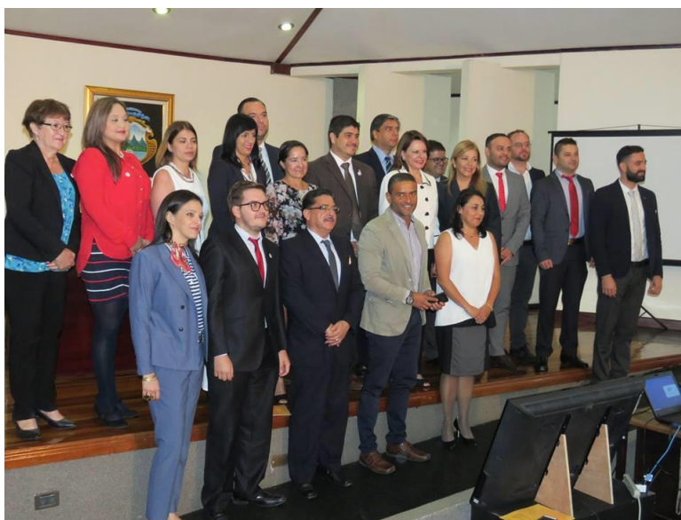
Ilustración 2: ULACIT suscribe el Acuerdo de San José en Casa Presidencial, en pro de las buenas prácticas laborales a favor de las personas sexualmente diversas.