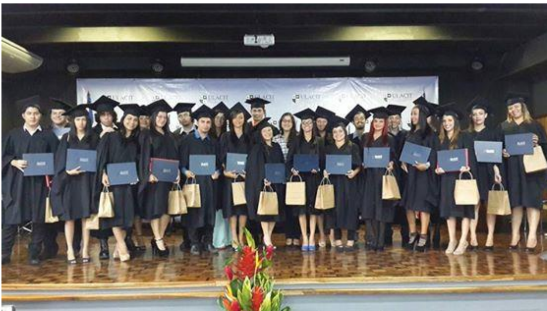
Ilustración 3: Tercera generación del programa EMPLÉATE.