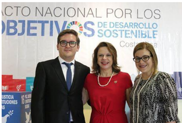
Ilustración 5: ULACIT firma el Pacto Nacional para el Cumplimiento de los ODS. En el centro, la vicepresidenta de la República de Costa Rica, Sra. Ana Elena Chacón.