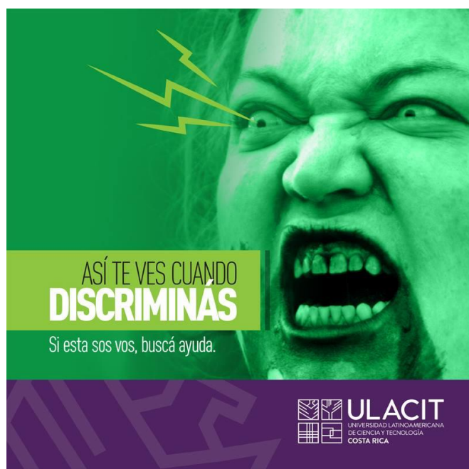
Ilustración 4: Campaña de concienciación sobre la discriminación por orientación sexual, a cargo del Diversity Club.