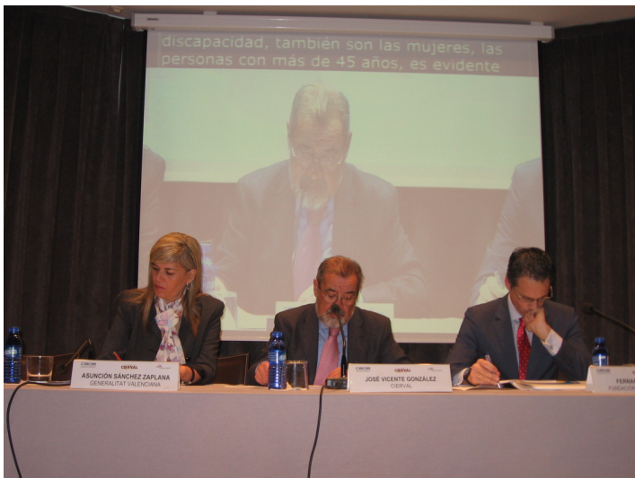
Jornada Innovación y Competitividad a través de la accesibilidad y el empleo de las personas con discapacidad (29 de enero de 2015)