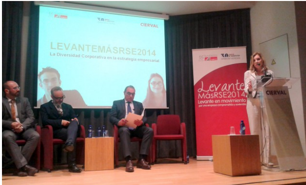
Jornada Levante MásRSE (28 de octubre de 2014)