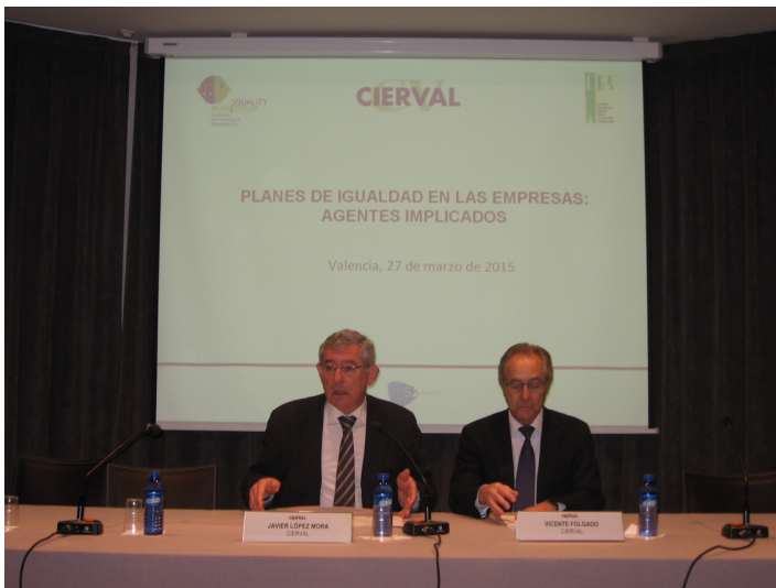
Jornada Planes de igualdad en las empresas: agentes implicados (27 de marzo de 2015)