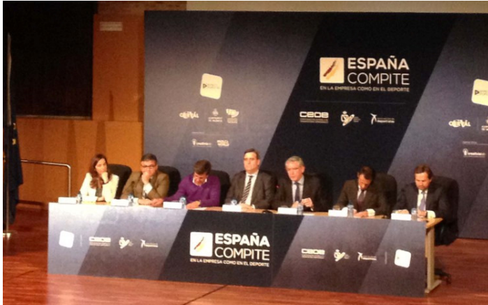
Jornada España Compite: en la empresa como en el deporte (18 de febrero de 2015)