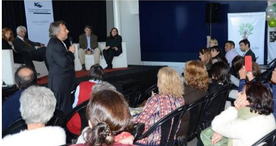
Reunión del Club de Empresas e Instituciones Comprometidas de San Isidro

Además la municipalidad ofrece una reducción en las tasas a las empresas que empleen a personas con discapacidad física o intelectual. El beneficio también se aplica si contratan a proveedores –de servicios o productos- donde trabajen personas con discapacidad. Así, la municipalidad, actúa como conector entre las empresas y las instituciones y estas últimas se comprometen a brindar capacitaciones en oficios con cursos y talleres específicos.