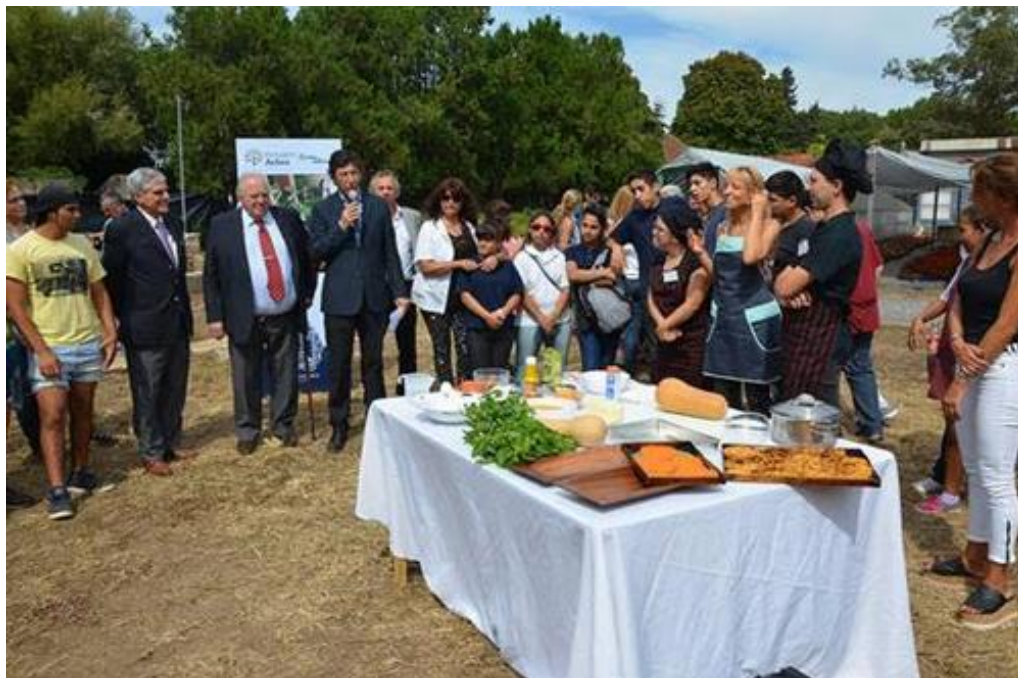
Inauguración “Inclusión activa, cocina natural”

También se suscribió al programa de capacitación e inserción laboral Pro Huerta del INTA, que se realiza en el vivero del Hipódromo de San Isidro. El objetivo es promover la inserción laboral de personas con discapacidad intelectual, que se enmarca dentro del proyecto “Inclusión activa, cocina natural” un programa con título oficial que enseña a desarrollar y mantener huertas orgánicas.