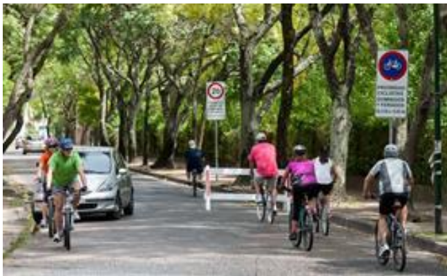
Calles con prioridad para ciclistas

El proyecto es la construcción de una red que vincule las distintas localidades y los puntos más importantes del partido ideado en base a tres variables: la calle con prioridad para bicicletas en las que los autos pueden circular, pero a no más de 20 km por hora; las ciclovías con un carril de ida y otro de vuelta; y las “calles de conexión” de sentido único de circulación, idéntico al de la arteria.