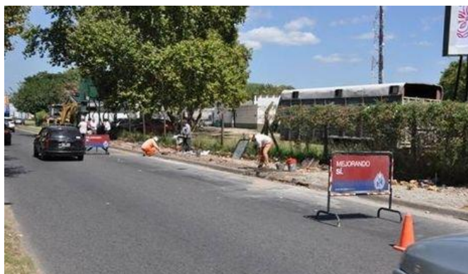
Construcción bicisenda alrededor del Jockey Club

La construcción de una bicisenda alrededor del Jockey Club es uno de los pasos del proyecto, en la zona del Bajo, los fines de semana se habilitan calles con prioridad para ciclistas como parte de un circuito recreativo, turístico y deportivo.