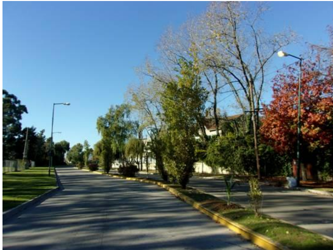
Nuevo boulevard de plantas nativas en Camino de la Ribera

Con el fin de preservar el ambiente natural de la costa, la biodiversidad, así como dar cuidado a las plantas nativas que son nuestro patrimonio natural, cultural e histórico, el municipio realizó un nuevo boulevard de plantas nativas en Camino de la Ribera, entre Roque Sáenz Peña y del Barco Centenera, en el Bajo de San Isidro.