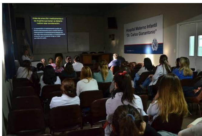
Taller “Lactancia materna, clave para el desarrollo sostenible”

También, en el marco de la Semana Mundial de la Lactancia Materna que se celebra del 1 al 7 de agosto, y bajo el lema “Lactancia materna, clave para el desarrollo sostenible” el Hospital Materno Infantil de San Isidro brindó talleres sobre la importancia de que los niños menores de seis meses sean amamantados.