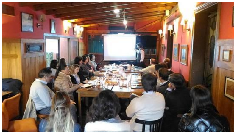
Reunión del Club de Empresas e Instituciones Comprometidas de San Isidro

Para fomentar la integración laboral de personas con discapacidad en San Isidro, el Centro Municipal para la Inclusión de las Personas con Discapacidad “Una mirada distinta”, se incorporó al Club de Empresas Comprometidas, conformándose el Club de Empresas e Instituciones Comprometidas de San Isidro (CEICSI), integrado por grandes, medianas y pequeñas empresas radicadas en el distrito, instituciones que abordan la problemática de la discapacidad, clubes sociales y deportivos y el Municipio de San Isidro, quien impulsa activamente esta propuesta desde la Secretaría de Integración Comunitaria.