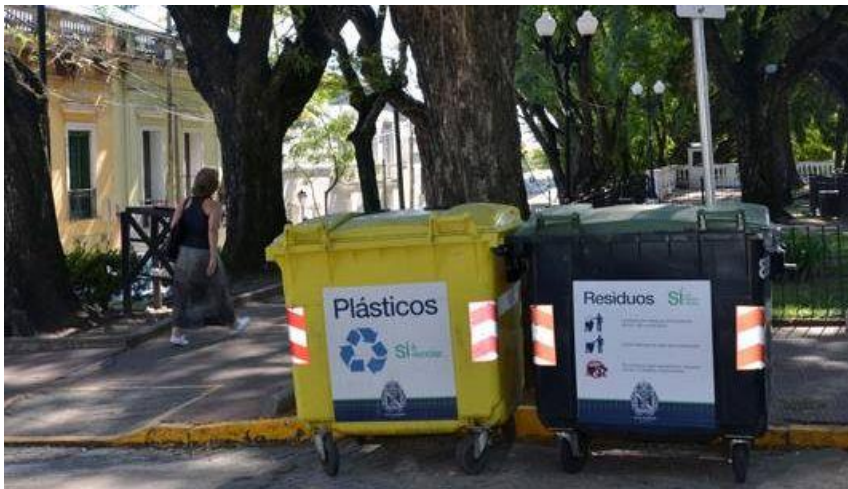
Contenedores diferenciales, ubicados en vía pública

Gran parte de los desechos que se generan pueden recuperarse a través del reciclado. Los envases de plástico, que los vecinos arrojan a contenedores diferenciales, reciben un tratamiento y el producto se transforma en recursos para el Hospital Materno Infantil de San Isidro.