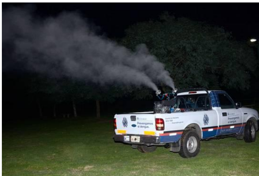
Operativo de fumigación en zona costera

En forma preventiva y con el objetivo de evitar la proliferación del mosquito Aedes Aegypti , transmisor del dengue, San Isidro realiza operativos sostenidos, desde hace más de cinco años, de fumigación, además de campañas de concientización para eliminar criaderos de mosquitos (agua estancada) y colocación de trampas en sitios estratégicos.