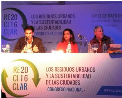
El Director de Reciclaje de San Isidro durante su ponencia en el Congreso

En lo referido a la promoción de mayor responsabilidad ambiental el municipio de San Isidro estuvo presente en el Congreso Nacional Reciclar 2016 “Los residuos urbanos y la sustentabilidad de las ciudades” que se realizó en la ciudad de Rafaela, Santa Fe; exponiendo el programa “San Isidro Recicla”.