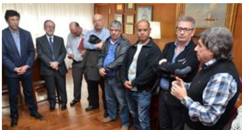
El Intendente Gustavo Posse junto a representantes del Sindicato de Trabajadores Municipales de San Isidro

También se firmó un acuerdo marco de cooperación y asistencia con la Asesoría General de Gobierno de la Provincia de Buenos Aires con el objetivo de precisar acciones y proyectos en conjunto.