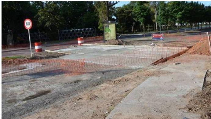
Construcción del cruce para conectar las ciclovías en la rotonda de Thames, en las avenidas Fondo de la Legua, Diego Carman, Unidad Nacional y Dardo Rocha

También se avanza en la construcción de cruces a fin de conectar los distintos circuitos de ciclovías existentes, a fin de brindar mayor seguridad a peatones y ciclistas y lograr la continuidad del circuito de aproximadamente cuatro kilómetros que conecta la Autopista Panamericana con la Estación Acassuso del Ferrocarril Mitre.