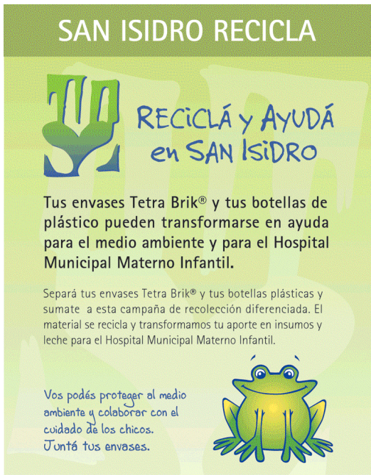
Folletería sobre el programa “San Isidro Recicla”