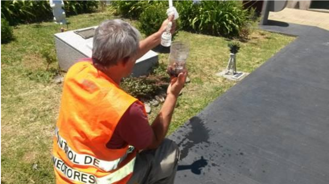
Control de vectores en trampas instaladas

Además se entrega a los vecinos material gráfico informativo sobre el dengue, sus síntomas, formas de propagación y prevención.