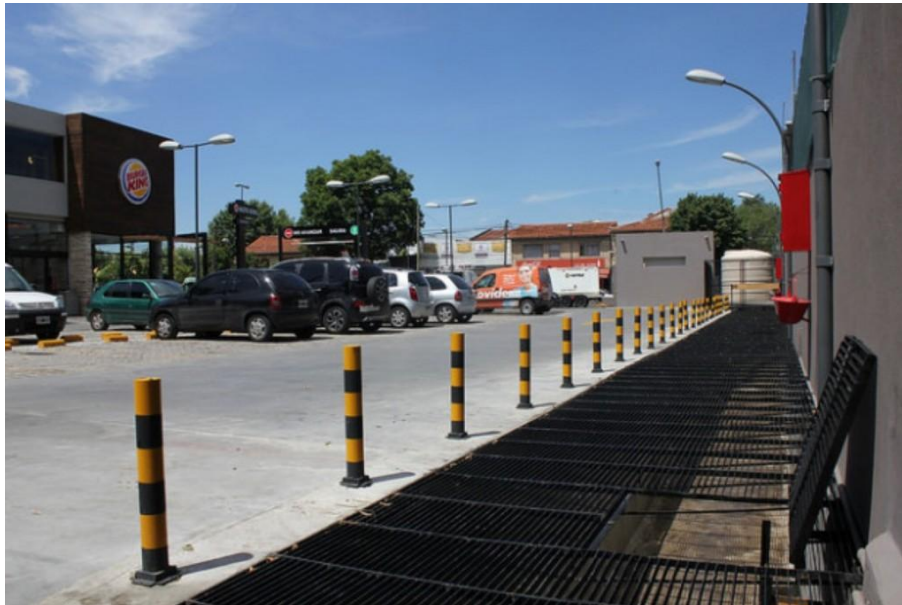
Reservorio en el estacionamiento de Burger King (Boulogne)

el volumen resulta mayor a 10 metros cúbicos, se deberá reutilizar el agua de lluvia para riego, limpieza y/o descarga de inodoros entre otros.