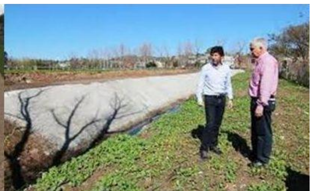
Imagen del proyecto y fotografía de las obras del reservorio del Bajo de San Isidro

Otro nuevo reservorio es el construido en colectora del Camino del Buen Ayre en la localidad de Boulogne, conectador directamente al sistema de desagote de la Estación de Bombeo N° 11, sobre el río Reconquista. Entre conductos de desagües, canales y el reservorio mejora la evacuación pluvial de unas 70 hectáreas de la zona.