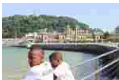
Visita a San Sebastián