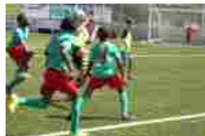
Visita al campus del Club Chamartín Vegara en Buitrago