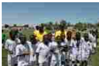
Evento de Hermanamiento entre ESD España - Mozambique