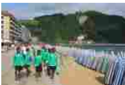
Visita a Zarauz