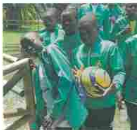
Los niños de la comunidad de San Mateo, en el barrio de San Mateo, en el barrio de San Mateo.