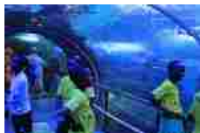
Acuario de San Sebastián