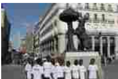
Visita a Madrid