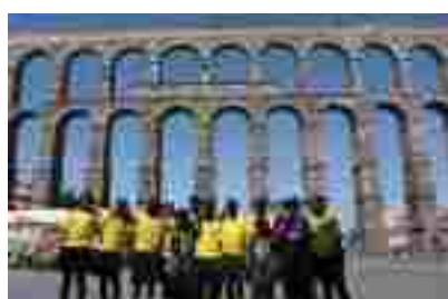
Visita a Segovia