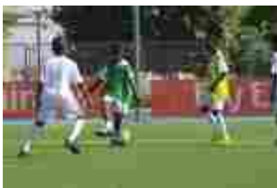
Visita a la Ciudad Deportiva del Real Madrid en Valdebebas