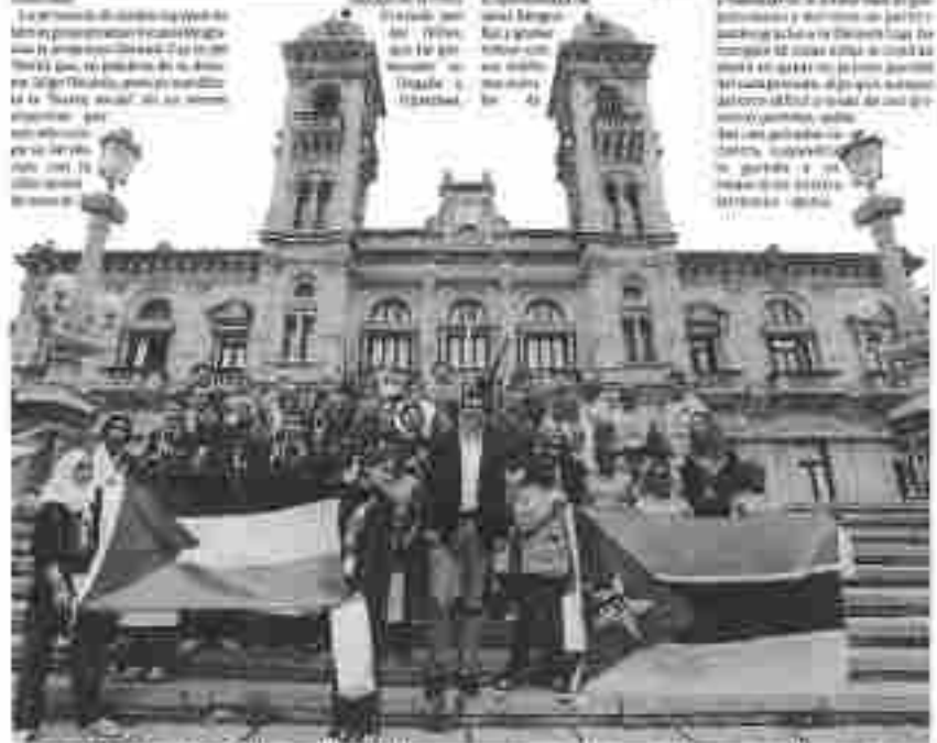
Los chicos de Mozambique y los chicos palestinos. Juntos van a representar a su país en la Donosti Cup.

El Ayuntamiento de Donostia ha organizado este torneo para promover el deporte entre los jóvenes de la zona. En esta ocasión, los equipos participantes son el Orfanato de Mozambique y el Campo de Refugiados de Palestina. Los equipos de Mozambique y Palestina son los únicos que participan en la Donosti Cup. Los equipos de Mozambique y Palestina son los únicos que participan en la Donosti Cup.