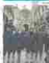
Los jugadores de la selección de fútbol de San Mateo, en el barrio de San Mateo, en el barrio de San Mateo.