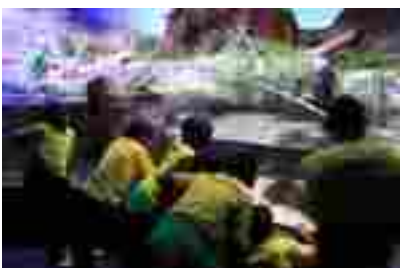
Acuario de San Sebastián