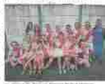
Los jugadores de la selección de fútbol de San Mateo, en el barrio de San Mateo, en el barrio de San Mateo.