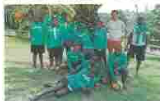
Los jugadores de la selección de fútbol de San Mateo, en el barrio de San Mateo.