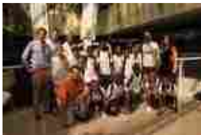
Oficina Fundación Real Madrid