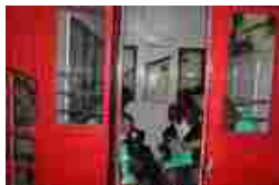
Funicular de subida al Monte Igeldo