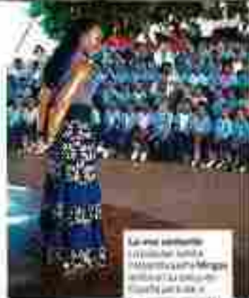
Kalender verteilte Tageszeiten für die Mittagspause mit einem Kaffee und einem Brot.

El modelo económico y social debe cambiar. Ha llegado la hora de que los ricos consideren como socios a quienes sobrevivan con menos de un euro al día»