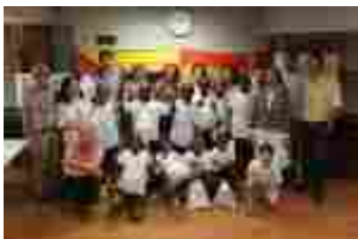
Oficina Cruzada por los Niños