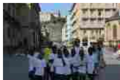
Visita a San Sebastián