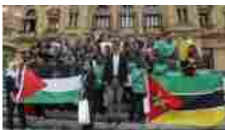
Recepción del alcalde de Donosti Eneko Goia en el Ayuntamiento