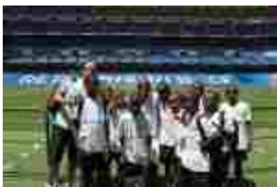
Tour del Bernabéu