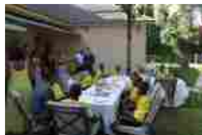
Residencia del Embajador