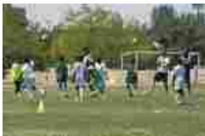
Entrenamiento en la ESD de Villaverde