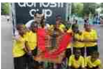
Oficina Donosti Cup