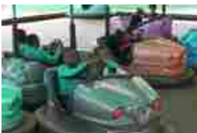
Parque de Atracciones