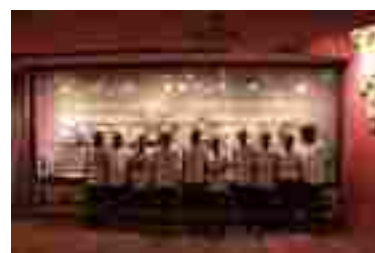
Museo de la Selección Española de Fútbol