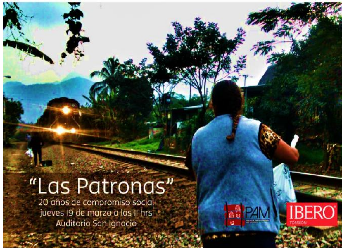
Video de la visita de Las Patronas a Ibero Torreón