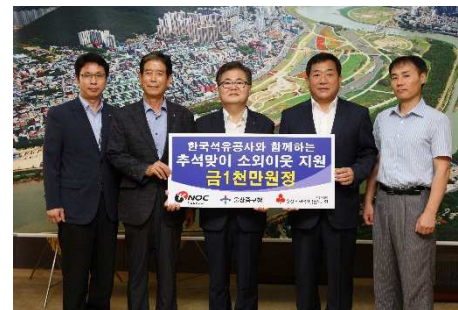
<명절맞이 소외이웃 지원금 전달>