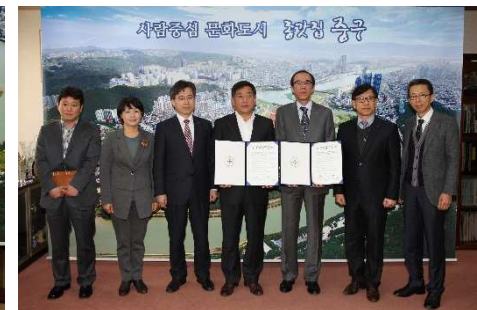
<집수리 봉사업무 협약식>