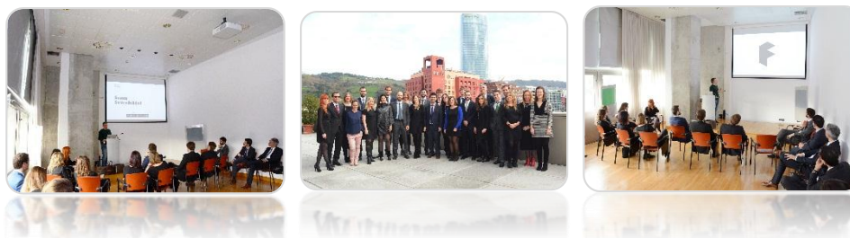
Ilustración 4: Imágenes de jornadas de capacitación en las que ha participado Factor durante 2015

Por otro lado, en 2015 la organización ha participado en diversas jornadas de temáticas relacionadas con la protección del medio ambiente y el desarrollo sostenible. En este sentido, Factor considera de vital importancia continuar con este tipo de difusión, tanto social como empresarial, de cara a promover el crecimiento verde como uno de los pilares fundamentales de su filosofía. Es por ello que se promueve en su comunicación a través de las herramientas de difusión existentes como la página web, las redes sociales o los boletines informativos editados por Factor de manera gratuita, así como en las notas de prensa elaboradas a este respecto.