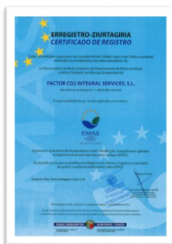
Ilustración 3: Certificado de inscripción en el Registro Comunitario de Gestión y Auditoría Medioambientales (EMAS)

Como empresa dedicada al sector medioambiental, Factor lleva a cabo diversas acciones relacionadas con la protección del medio ambiente y el respeto por el entorno, así como la concienciación en torno a la problemática del cambio climático y la importancia del desarrollo sostenible. Hay que señalar que anualmente la organización, de manera voluntaria, calcula, reduce y neutraliza su huella de carbono; es decir, compensa las emisiones de gases de efecto invernadero emitidas a la atmósfera como consecuencia del desarrollo de su actividad. De hecho, fue la primera empresa española que certifica la neutralidad de sus emisiones bajo la norma PAS 2060, práctica que ha continuado realizando cada año hasta la actualidad. Además, Factor trabaja bajo un sistema de gestión de la calidad y gestión ambiental ISO 9001 e ISO 14001 y EMAS. Bajo el esquema del EMAS, o Sistema Comunitario de Gestión y Auditoría Medioambientales, Factor realiza, desde el año 2008, su Declaración Ambiental, reflejo de su responsabilidad con el entorno sin dejar a un lado la calidad de sus servicios, que puede solicitarse públicamente a través de la página web o el contacto facilitado por la organización.