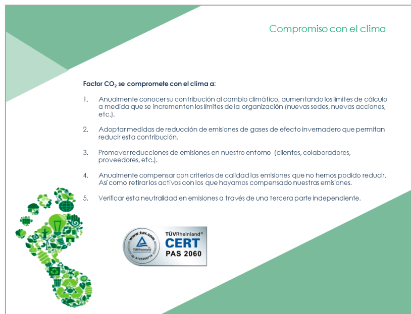
Ilustración 6: Compromisos con el clima de Factor

En relación con ello, la organización ha incorporado una línea específica de compromisos con el clima: