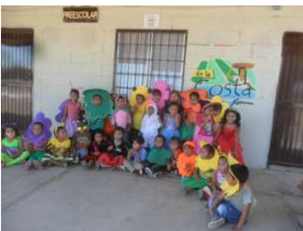
Festejo del día de la Primavera