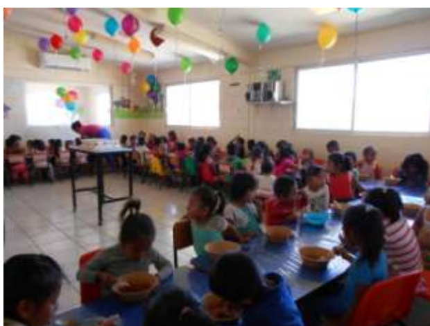
Festejo del día del niño