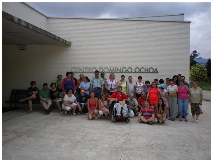
Intercambios entre Logroño y Calahorra