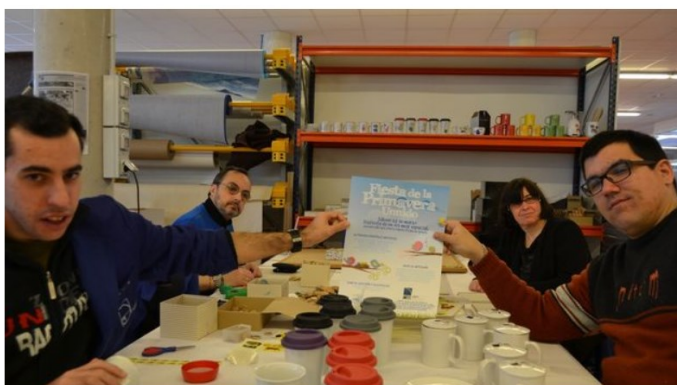
Foto 1 de ARPS celebrará este sábado la 'Fiesta de la Primavera Unnido'