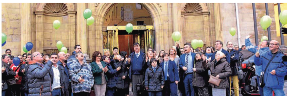
Todos juntos, en la entrada al Parlamento de La Rioja, soltaron globos de colores con motivo del acto institucional.