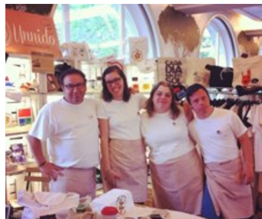
Participación en la Feria Fundamarket en Madrid