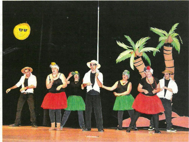
Usuarios, y también trabajadores de ARPS, se subieron al escenario para realizar o participar en diferentes representaciones teatrales con motivo de la Navidad.