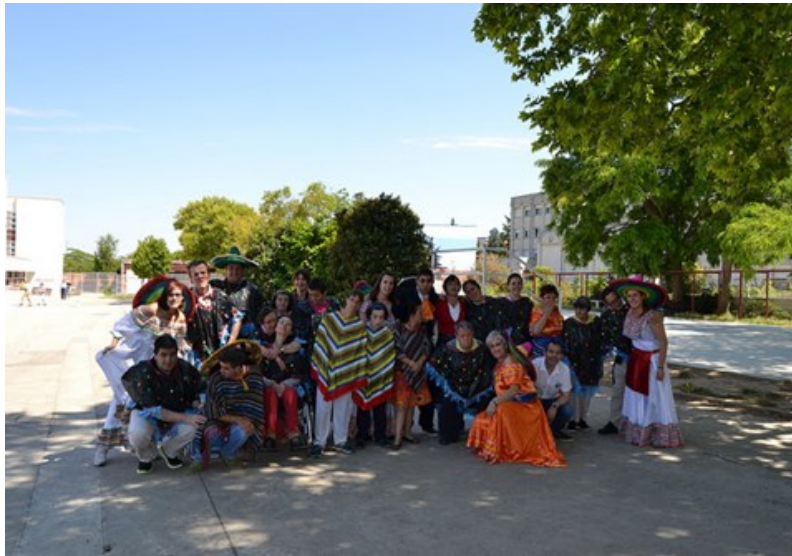
Fiesta Familias Residencia Los Valles de Logroño