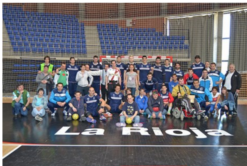
Visita al Naturehouse