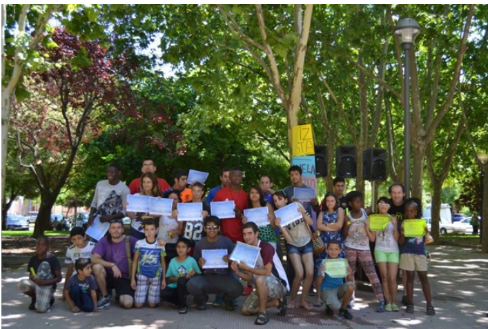
Escuela Abierta de Verano dentro Proyecto ICI