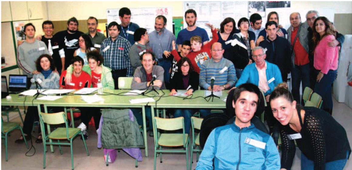
Alrededor de la mesa hubo nervios pero mucho más entusiasmo en el programa piloto.