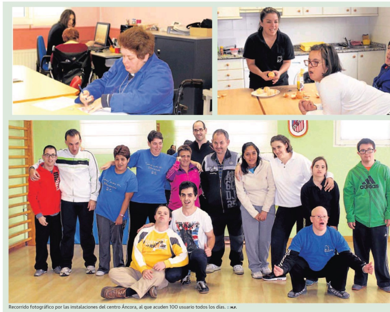
Recorrido fotográfico por las instalaciones del centro Áncora, al que acuden 100 usuarios todos los días. : : ✖