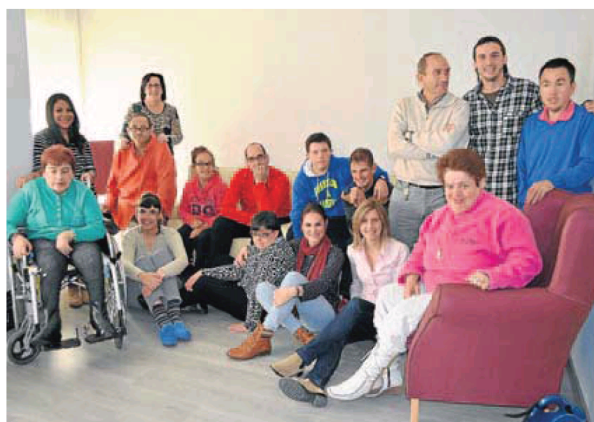
Profesionales y residentes, en el salón del centro residencial.