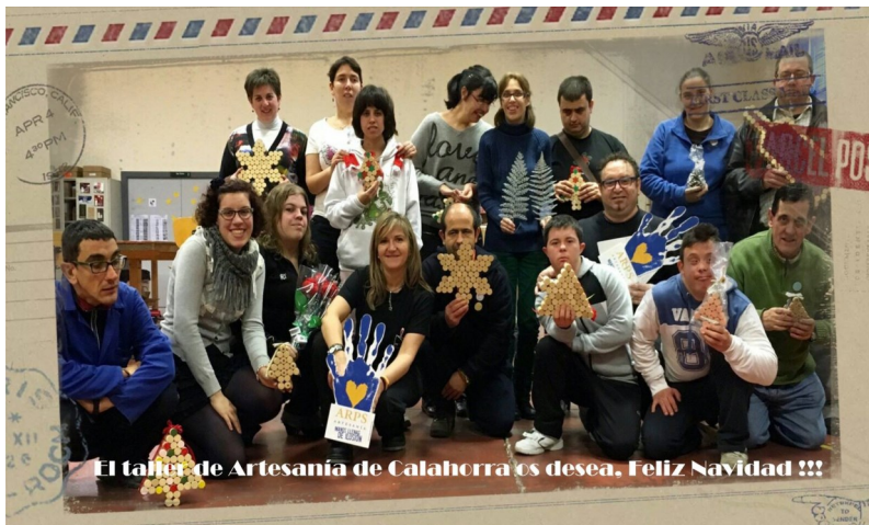
El taller de Artesanía de Calahorra os desea. Feliz Navidad !!!