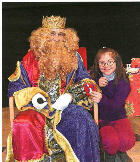
No faltó la visita anticipada de los Reyes Magos.

Siguiendo con las actividades, la Residencia Los Valles también organizó una cena navideña para todos los residentes en la que hubo juegos, música y regalos navideños; y el Centro Áncora de ARPS en Calahorra además planteó diferentes actividades navideñas, tales como talleres de galletas, karaoke de villancicos y reparto de regalos con Papa Noel. Además de todas estas actividades internas, los miembros de ARPS recibieron hace unos días la visita de un grupo de personas mayores de la Residencia San Justa, que cantaron villancicos para las personas con discapacidad de estos centros. Como colofón a la celebración