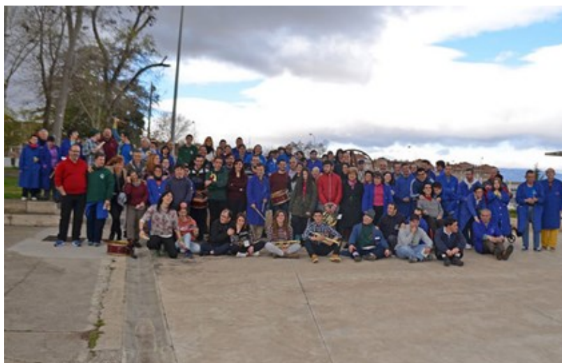
Visita de la Hermandad de Cofradías de la Pasión de la Ciudad de Logroño