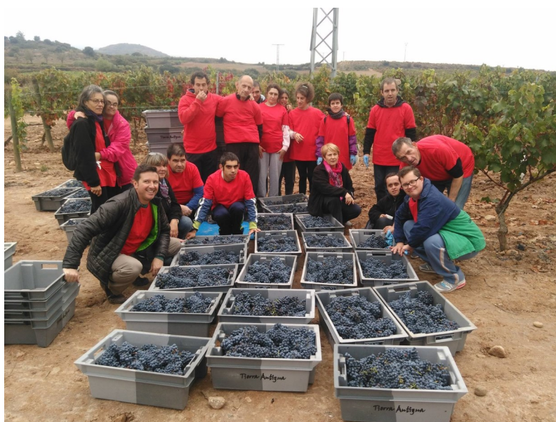
Vendimia en las Bodegas Vinícola Real.