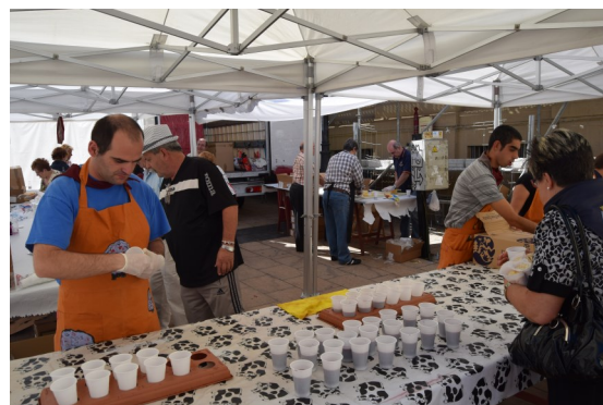
Degustación Centro Cántabro San Mateo