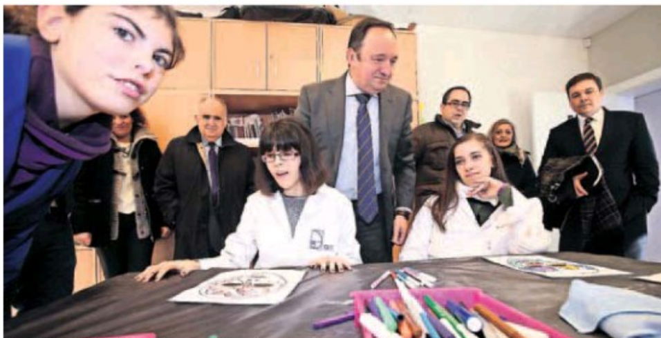
El presidente de La Rioja, Pedro Sanz, compartió un rato con los alumnos.