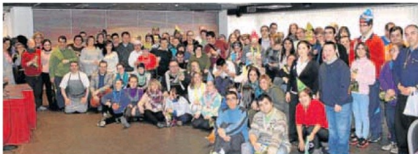
Foto de familia de todos los integrantes del Centro Áncora en la fiesta del hotel Victoria arnedano.

:: E. P. Como manda la tradición desde hace una década, las personas que reciben apoyos y los profesionales del Centro de Atención Diurna Áncora de Calahorra, de la Asociación Riojana Pro Personas con Discapacidad Intelectual (ARPS), disfrutaron este viernes del Carnaval en el hotel Victoria de Arnedo.