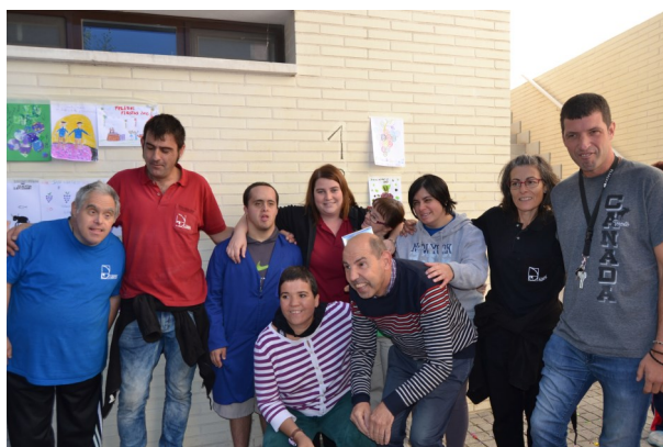
Fiestas San Mateo