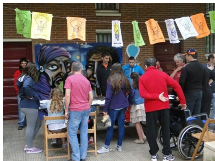
‘Mercado de las Ideas’ Iniciativa enmarcada en el Proyecto Intervención Comunitaria Intercultural