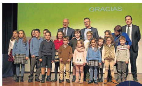
La celebración prosiguió por la tarde con una gala.

El acto concluyó con una suelta de globos a las puertas del Parlamento. No obstante, ayer se sucedieron otras citas para apoyar al colectivo. Destacó la gala conmemorativa que acogió la Sala Gonzalo de Berceo y que contó con la presencia del presidente regional, José Ignacio Ceniceros. Durante el evento se celebró también el 20 aniversario del programa 'Integra en la Escuela'. Asimismo, el centro Áncora desarrolló diversas iniciativas, en las que participó el chef Francis Paniego, y el consejero Escobar acudió por la tarde a la jornada de sensibilización 'Ponte en su lugar', que invitó a los ciudadanos a ocupar por unos momentos la posición de una persona con discapacidad.