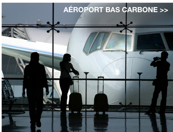
AÉROPORT BAS CARBONE >>

Les aéroports d'Abidjan (Côte d'Ivoire) et Libreville (Gabon) exploités par Egis ont été certifiés « Airport Carbon Accreditation » (sur 3 aéroports certifiés en Afrique). Ces deux aéroports confirment leur volonté de mettre en place un plan d'actions pour maîtriser et diminuer leur empreinte carbone.