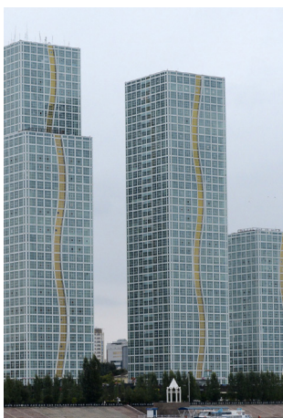
ASTAINABLE®, UNE VILLE DURABLE 3.0

Sous l'impulsion de Vivapolis, Egis et ses partenaires Eiffage et Engie ont imaginé Astainable®, outil interactif de design urbain . Mis au point pour répondre aux besoins de développement d'Astana, capitale du Kazakhstan, ce simulateur valorise les savoir-faire des entreprises françaises en matière de ville durable.