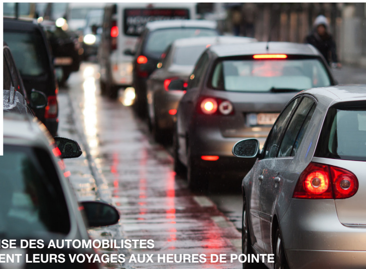
<< RÉCOMPENSE DES AUTOMOBILISTES QUI DIFFÈRENT LEURS VOYAGES AUX HEURES DE POINTE

Les aéroports d'Abidjan (Côte d'Ivoire) et Libreville (Gabon) exploités par Egis ont été certifiés « Airport Carbon Accreditation » (sur 3 aéroports certifiés en Afrique). Ces deux aéroports confirment leur volonté de mettre en place un plan d'actions pour maîtriser et diminuer leur empreinte carbone.