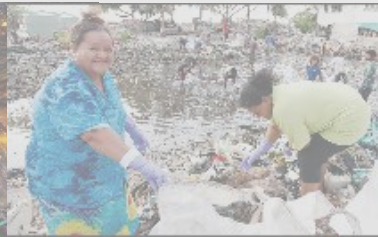
■ 전 세계 클린월드 운동