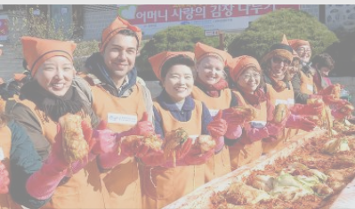
■ 김장김치 담그기