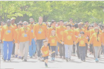
■ 새생명 사랑 가족 걷기대회