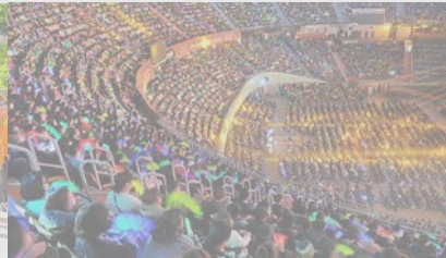
■ 새생명 사랑의 콘서트