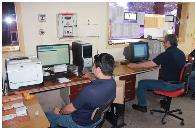
Funcionarios del área administrativa realizando sus labores.

E n esta Comunicación de Progreso Anual (COP) damos cuenta de que, como entidad pública descentralizada del Estado, PETROPAR está obligada a observar y hacer cumplir, meticulosamente, todas las disposiciones constitucionales, legales y acuerdos internacionales relativos a los derechos humanos, incluso a niveles superiores al del sector privado.