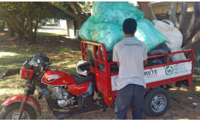
Retiro del material a ser reciclado por parte de la empresa especializada.

Se realizaron charlas de capacitación y conciencia en las diferentes sedes de la Empresa (Oficina Central, Planta Villa Elisa y Planta Mauricio José Troche), acerca del cuidado del medio ambiente con la implementación de un Programa Interno de Reciclaje.