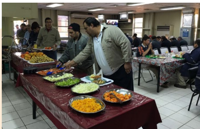
Comedores de Oficina Central y Planta Villa Elisa.