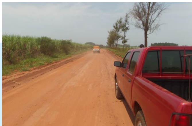
PETROPAR como medida de responsabilidad social contribuye al mantenimiento de caminos y puentes en la zona del Departamento del Guairá.

La realidad nos dice que si los caminos vecinales no son transitables, los productores no podrán movilizar