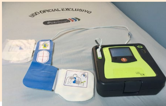
Desfibrilador externo automático adquirido para su utilización en la enfermería.