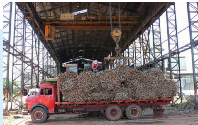
Grandes cantidades de caña de azúcar son utilizadas como materia prima para la fabricación de biocombustible.

El control sistemático de emisiones de algunos gases nocivos es una operación de rutina que beneficia a la calidad del aire, así como también constituye un factor de seguridad industrial al mantener bajo control la concentración de gases explosivos en el ámbito de la Planta.