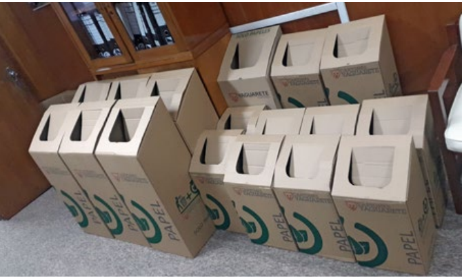
Contenedores para el reciclaje de cartones y papeles, actividad fomentada por nuestra empresa.