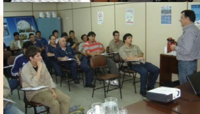
Imágenes de las distintas capacitaciones llevadas a cabo para los funcionarios de Petropar.