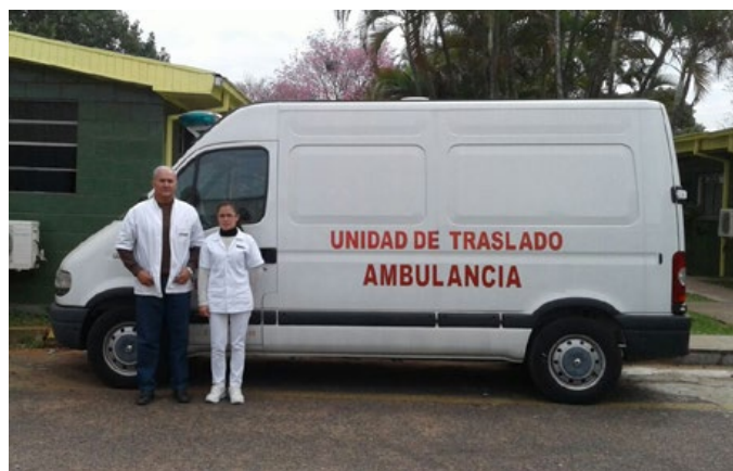
Ambulancia propia de la empresa preparada para atención y traslado del personal.

La Institución cuenta también con un contrato de servicio de ambulancia prestado por la empresa SASA S.R.L., cuya área protegida comprende: Oficina Central, Planta de Villa Elisa y Planta Calera Cué.