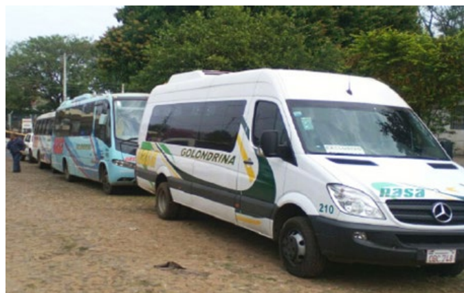
Transportes contratados para el servicio de traslado del personal.

PETROPAR provee a los funcionarios de la Institución un servicio de transporte que los traslada desde y hasta el lugar donde presta servicio, a través de una empresa privada contratada para el efecto. La mencionada empresa es seleccionada en virtud de una licitación pública. Las unidades de transporte deben ajustarse a parámetros de calidad, confort, seguridad y puntuali-