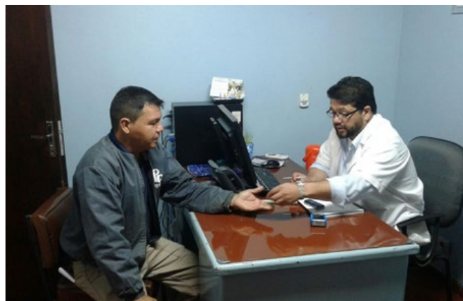
Atención personalizada para los funcionarios de Petropar.