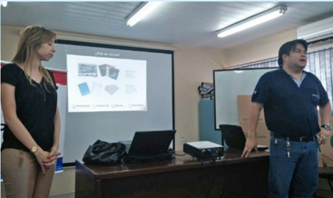
Encargados de la capacitación durante una de las charlas.

Se realizaron charlas de capacitación y conciencia en las diferentes sedes de la Empresa (Oficina Central, Planta Villa Elisa y Planta Mauricio José Troche), acerca del cuidado del medio ambiente con la implementación de un Programa Interno de Reciclaje.