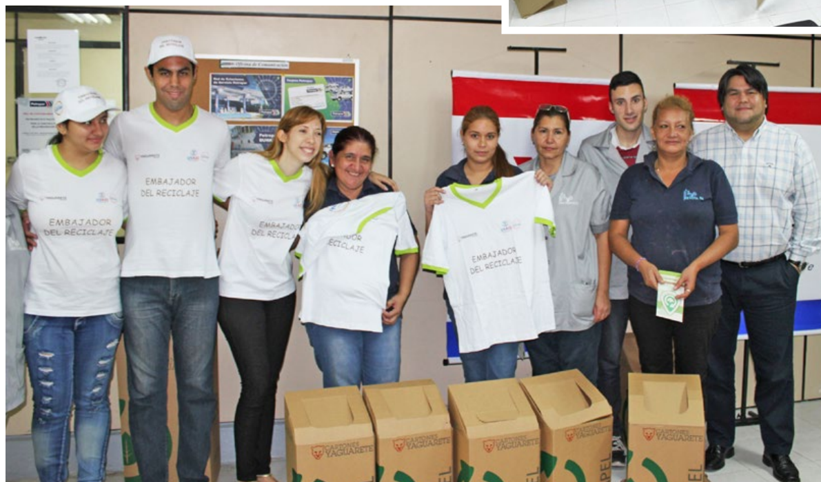
Imágenes de la capacitación ofrecida al personal a través de la cooperación de la Fundación Sarakí y Cartones Yaguareté.