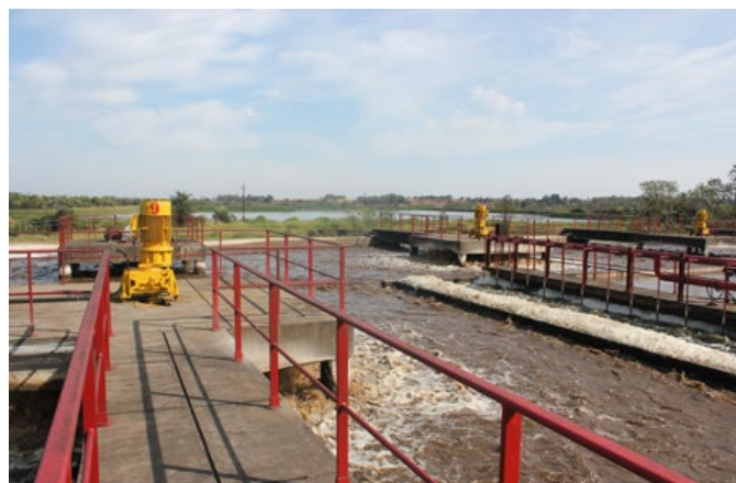
Tratamiento de efluentes industriales.