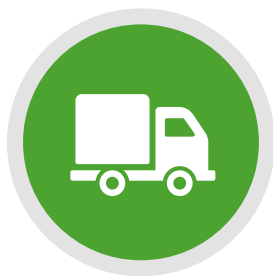
03 EL PROVEEDOR PÁG.34