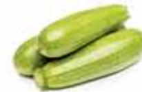
Calabacín Blanco 3.000.000 kilos