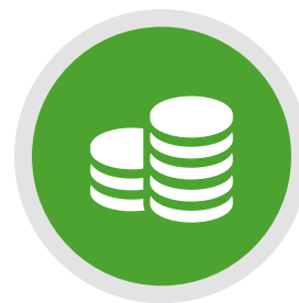
05 EL CAPITAL PÁG.44