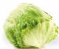
Iceberg 45.000.000 unidades