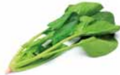
Espinaca 4.000.000 kilos