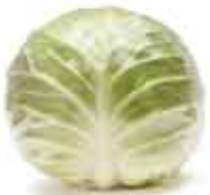
Coles 8.000.000 kilos