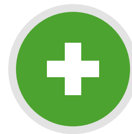
06 ANEXO PÁG.52