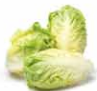
Little Gem 47.000.000 unidades