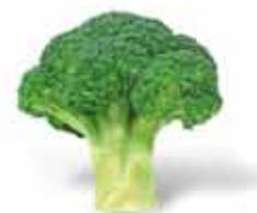
Brócoli 11.000.000 kilos