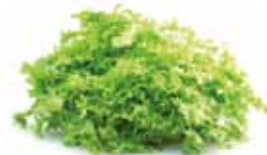
Escarolas 4.000.000 kilos