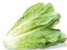
Romana 43.000.000 unidades