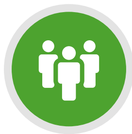
04 LA SOCIEDAD PÁG.38