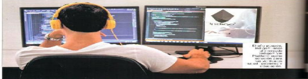
El año pasado, Indigo lanzó al mercado su plataforma de solución para las instituciones de salud, gobierno y educación.

Colombia en Línea, en la categoría 'Mejor aplicación en salud'. Además, en 2013, el propio Ministerio de las Tecnologías de la Información y las Comunicaciones la reconoció como una de las firmas emergentes más novedosas del año. Ahora, Indigo quiere expandir su portafolio de servicios en el sector educativo, gubernamental y de salud. Tarea para que la que ya invirtió 1.800 millones de pesos, convirtiéndose así en una empresa que garantiza un servicio vertical, manteniendo iniciativas educativas del sector público. Aunque sea un camino inexplorado, ya hicieron un primer acercamiento al abrir una nueva sede en Bogotá. Indigo está conformada por 50 personas que trabajan para imaginar y crear soluciones innovadoras. Una misión que implica paciencia y mucha dedicación. "Siempre hay tiempo para un buen producto", dice su fundador.