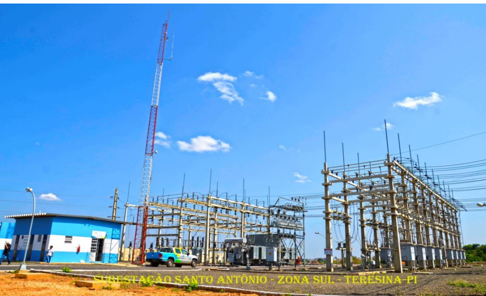
SUBESTAÇÃO SANTO ANTÔNIO - ZONA SUL - TERESINA-PI